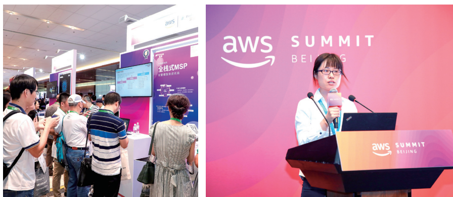
本集團參加了 AWS 2019 技術峰會以 及富通 AI Lab 負責人李博士 發表「AI 在零售 企業數字化轉型中 的挑戰與實踐」演講