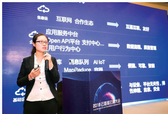
本集團參加2019 雲管和雲網大會