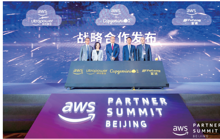
在AWS 2019年合作夥伴峰會上，本集團與AWS簽署了戰略合作協議

同時，富通雲騰成功通過中國電子工業標準化技術協會資訊技術服務分會之雲服務能力符合性評估，獲得私有雲IaaS服務能力三級認證。以上獎項及認證，不僅是對本集團雲計算管理產品之認可，亦是對本集團堅持以客戶為導向而不斷優化產品和革新技術之肯定。