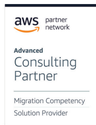
本集團成功獲取 AWS 遷移能力認證