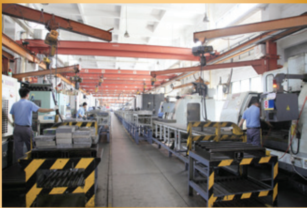
中國浙江省杭州廠之模架生產線 Mould base production lines at Hangzhou factory, Zhejiang Province, China