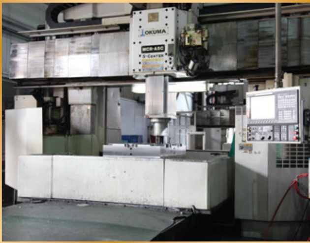
加工中心正為一件大型模架進行加工 A CNC machining centre is processing the machining process for a large size mould base