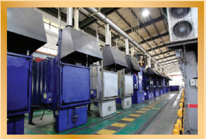
多用途熱處理爐可提供各種不同的熱處理加工服務 Multi-purpose heat treatment furnaces can provide various kinds of heat treatment services