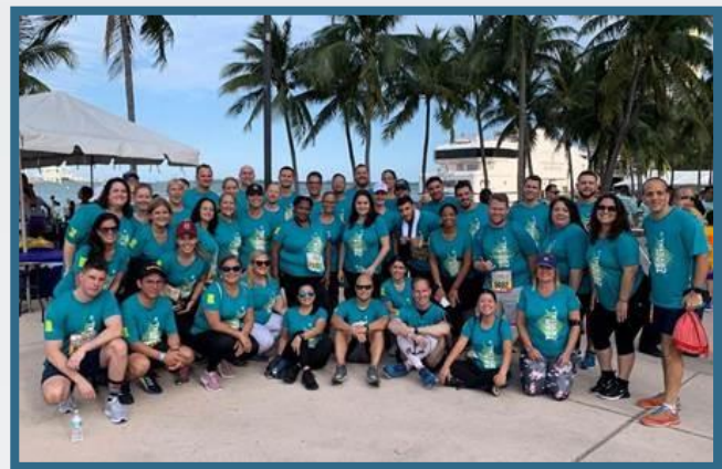
Mercedes-Benz 邁阿密企業跑步活動

除了舉辦員工團體活動，本集團通過不同正規和非正規渠道與員工就工作事宜保持溝通。我們亦歡迎船員及岸上員工分別與船上人事經理及人力資源部保持溝通，以提出反饋和查詢。本集團一直對員工保持開放和積極的態度，希望為員工創造和諧共融的工作氣氛。