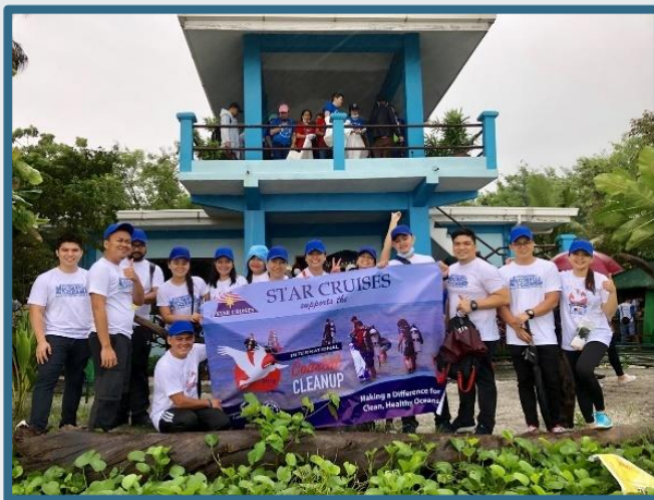
國際海岸清潔運動

另一方面，我們馬尼拉的員工於拉梅薩自然保護區 ( La Mesa Eco Nature Reserve ) 進行植樹活動。我們相信，以上的簡單舉動都在為拯救地球貢獻一份力。