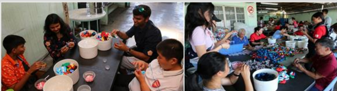
雲頂夢號的客人與船員共同參加各項種活動，並與 Eden Handicap Service Center 的居民互動。

我們在亞洲不同目的地精心挑選了一系列的社區活動供客人參與。這些志願活動旨在讓家人和朋友共聚一起，並分享因助人而得到的快樂。全年內，顧客和船員共投放了超過 900 小時與我們一同為社區服務。