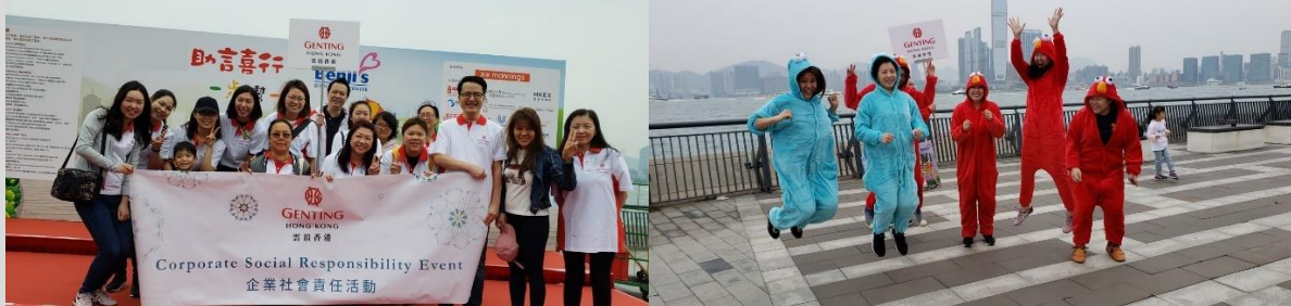
義工們全程投入參與庭恩兒童中心的慈善步行籌款活動。

過去多年，我們一直與庭恩兒童中心携手合作舉辦慈善活動。該中心是非牟利團體，專為有語言障礙的低收入家庭兒童提供言語治療服務。今年，我們的義工參與了《助言喜行，一步，幫一生》的慈善步行籌款，向有語言障礙的兒童予以支持鼓勵。