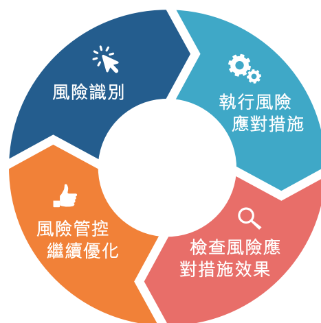
(圖二、風險評估管控模式)

本年度，集團管理層通過對上年度風險評估中識別的管控提升點的落地情況進行跟進，形成持續的「風險識別－風險管控落地－檢查跟蹤－持續優化」的循環管控模式，確保重大風險管理薄弱點得到有效改善，以持續提升集團的風險防範與應對能力(詳見圖二：風險評估管控模式)。