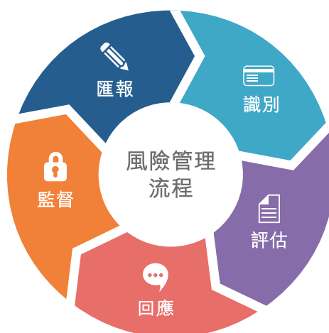
(圖一、風險管理流程)