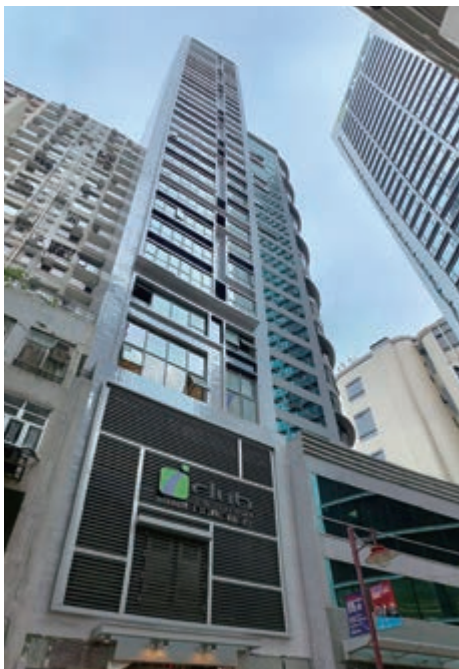
位於上環文咸西街5至7號及永樂街169至171號將予命名為「富薈上環II酒店」