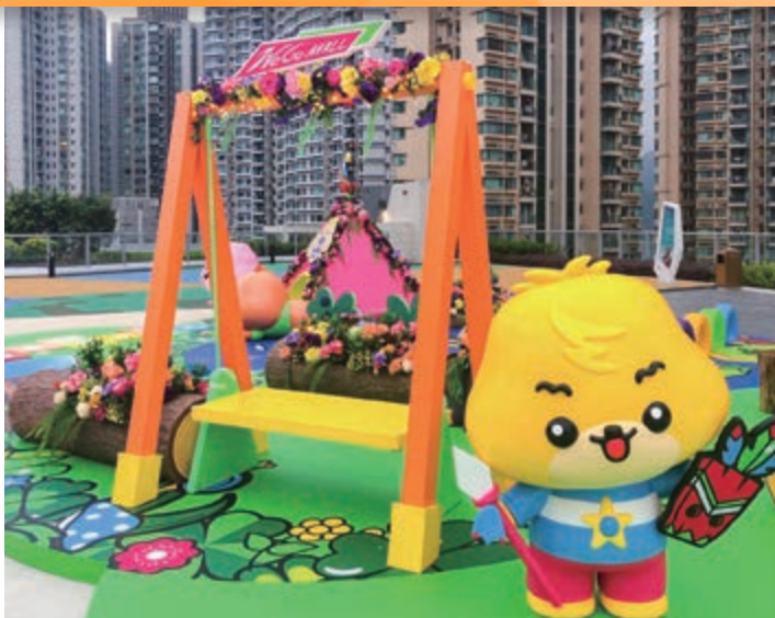
寶狄與好友於2019年暑假期間在We Go MALL 舉辦商場活動