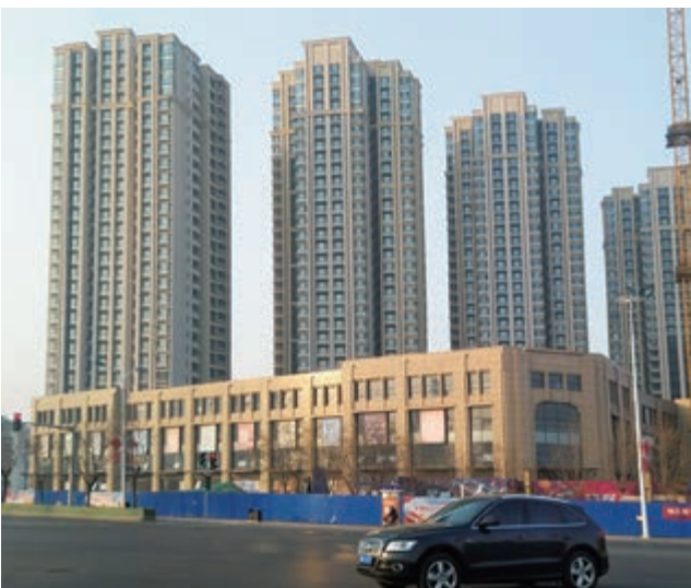
富豪新開門之住宅大樓及商業綜合大樓 — 已落成