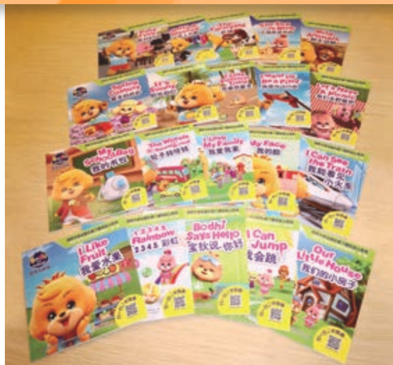
寶狄與好友版權圖書授權予浙江少年兒童出版社進行印刷及銷售—20本圖書套裝會於2020年推出市場。