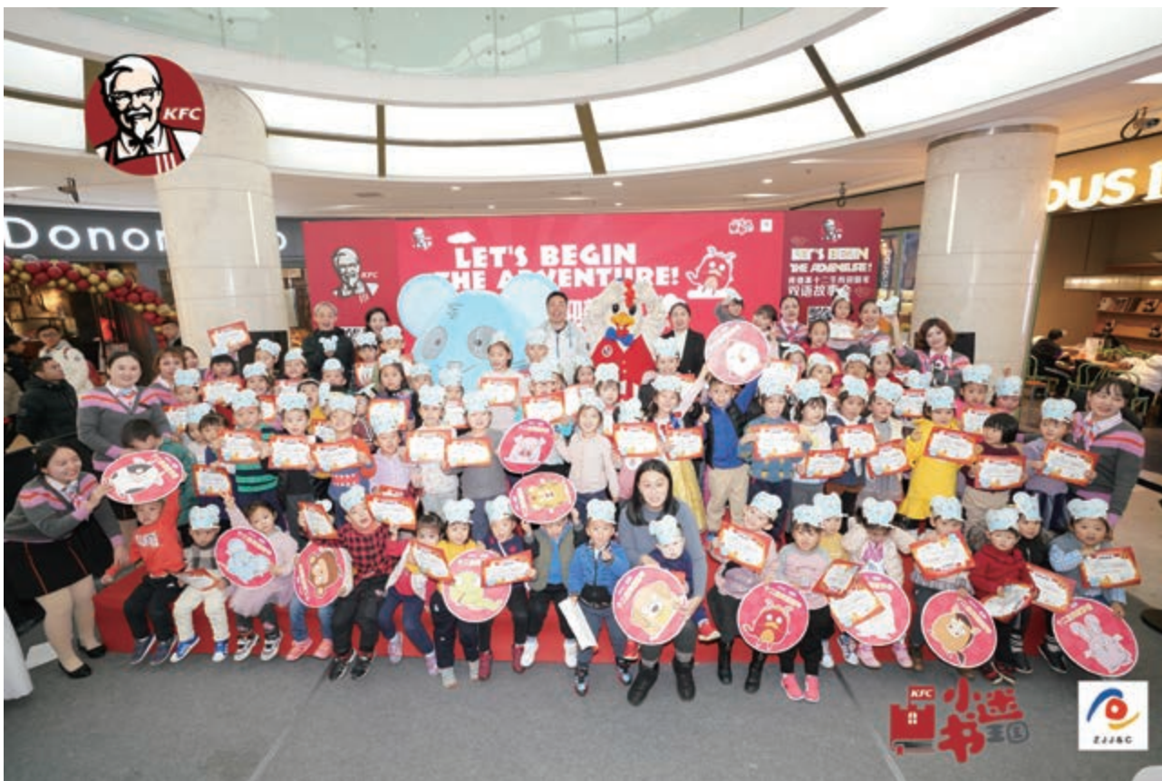
連續第三年與中國肯德基合作舉辦推廣閱讀線下活動 於中國肯德基旗下超過4,000間餐廳派發超過160萬本圖書。