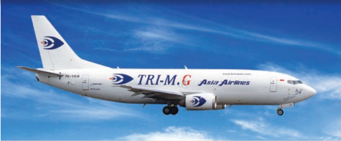
波音 737-33A (SF)