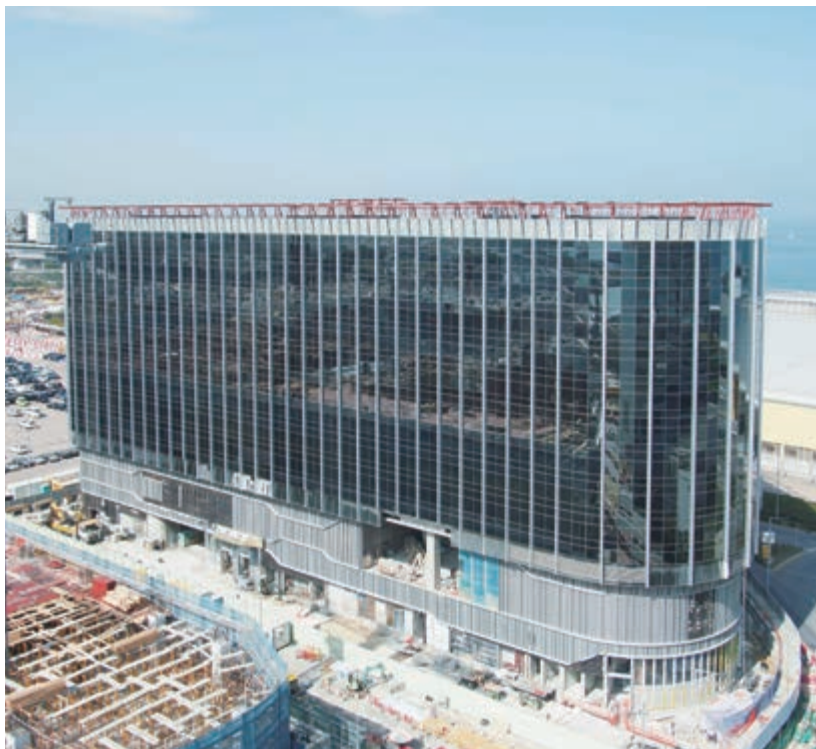
麗豪航天城酒店 — 上蓋建築工程已完成