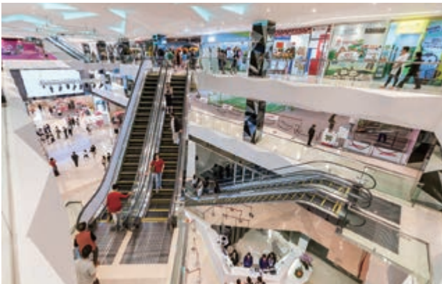
We Go MALL之中庭