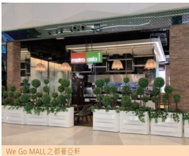
We Go MALL之都薈亞軒