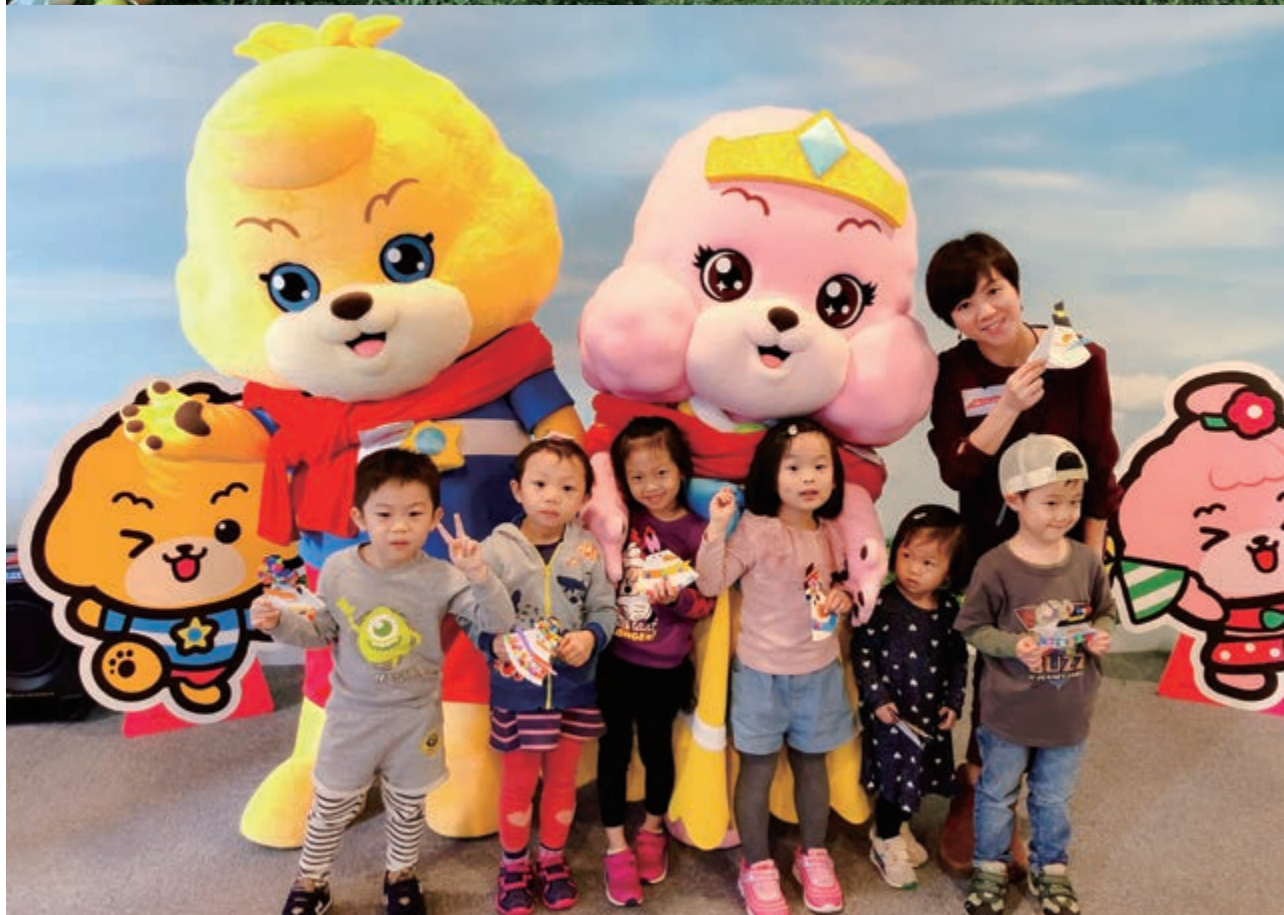
寶狄與好友於2019年復活節期間在We Go MALL 舉辦商場活動