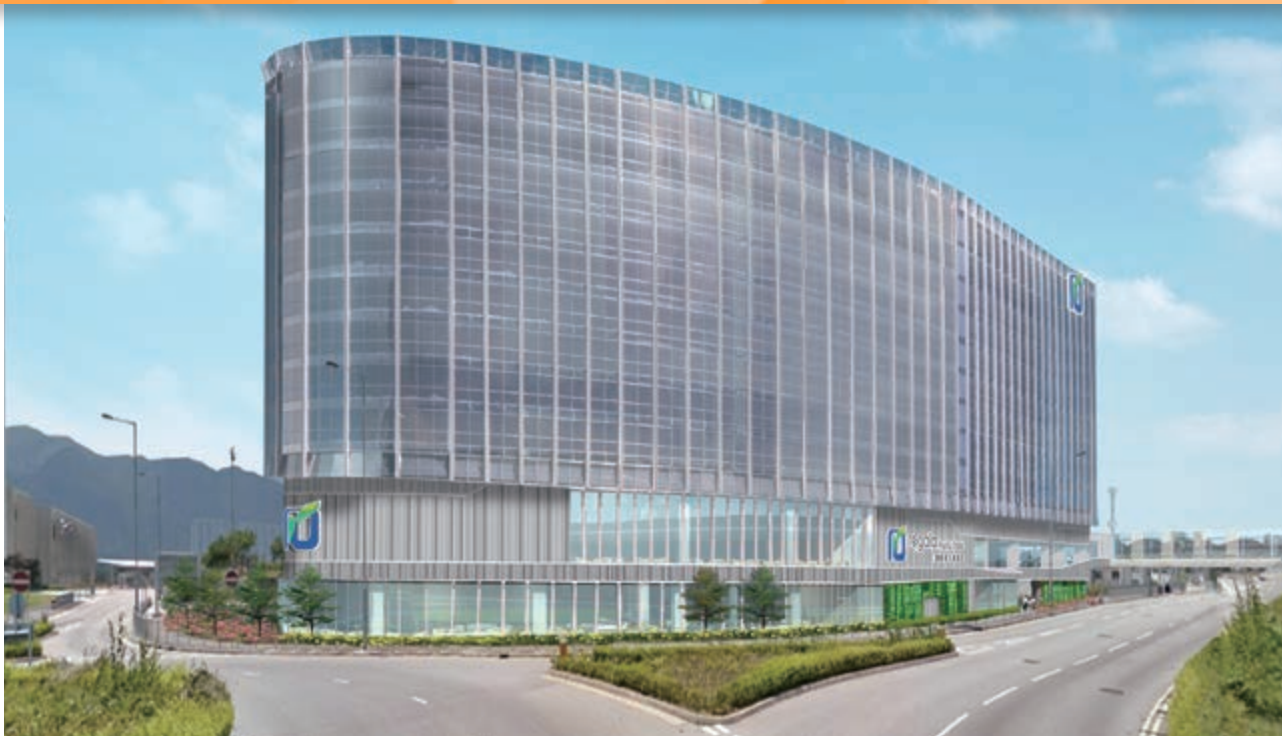
位於香港國際機場赤鱗角地段第3號將予命名為「麗豪航天城酒店」之新酒店項目(*)