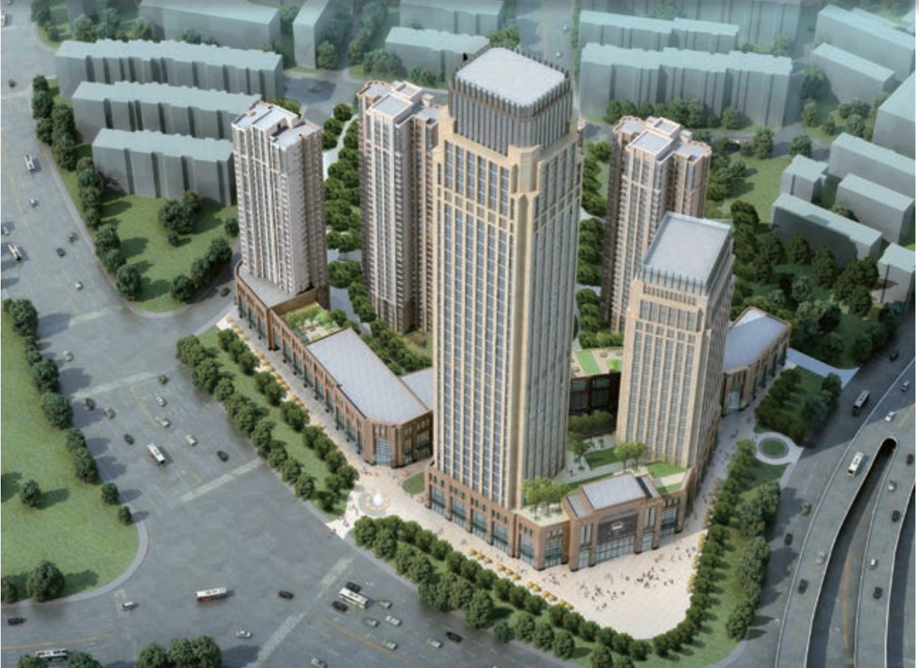
富豪新開門 — 位於天津河東區黃金地段之商業/寫字樓/住宅綜合發展項目(*)