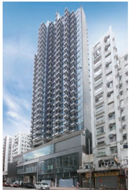
尚都 — 位於九龍深水埗順寧道83號之商業 / 住宅發展項目