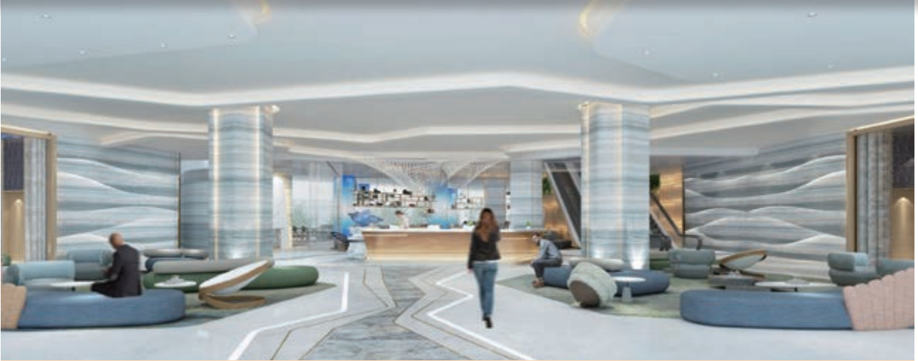
麗豪航天城酒店之大堂(*)