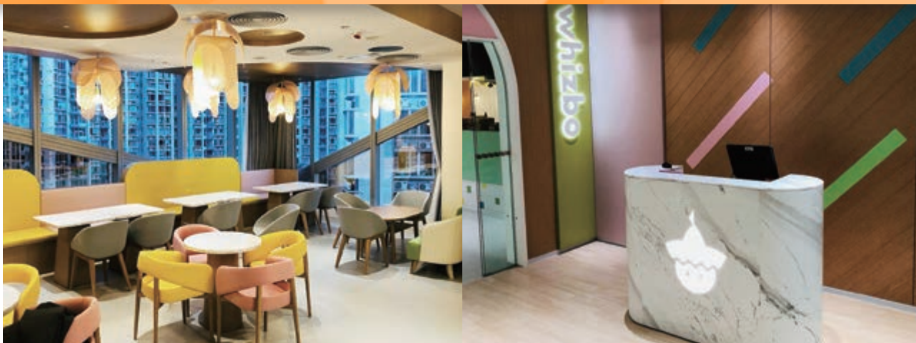
We Go MALL之智寶星親子餐廳