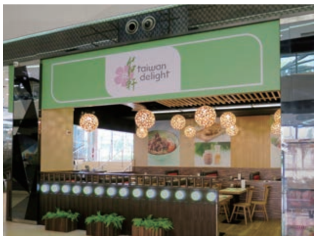
We Go MALL之台軒