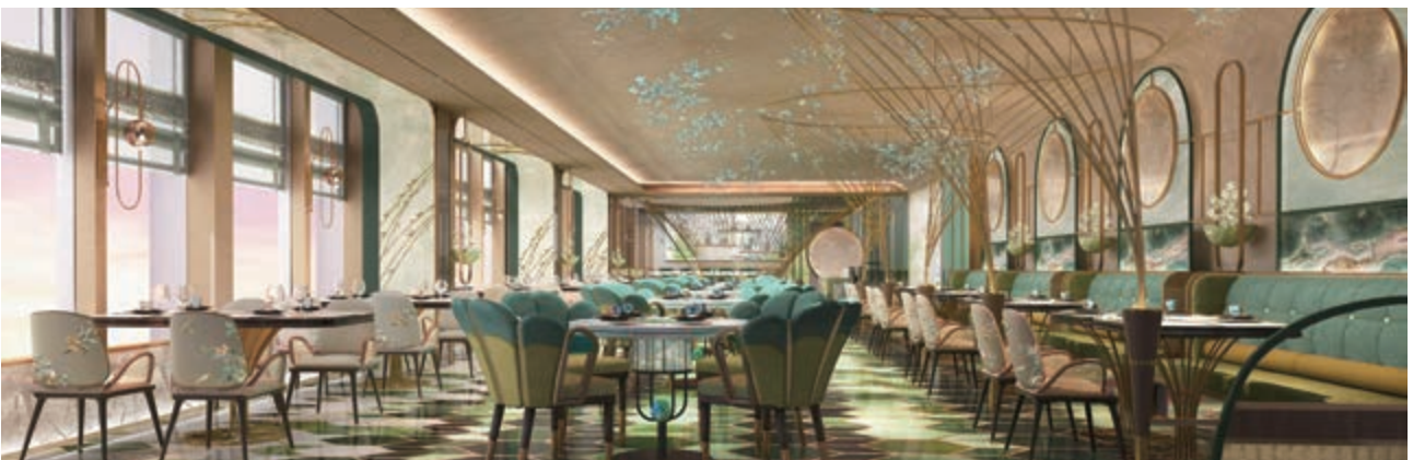
麗豪航天城酒店之中菜廳(*)