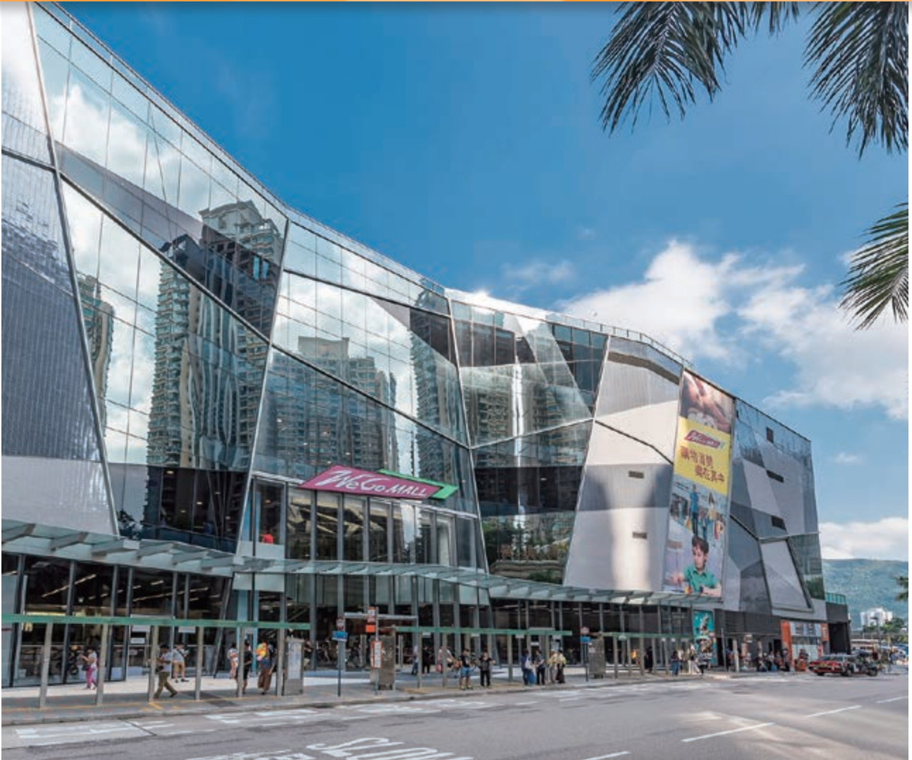
We Go MALL — 位於新界沙田馬鞍山保泰街16號之購物商場