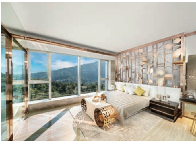
富豪 • 山峯之住宅單位的睡房