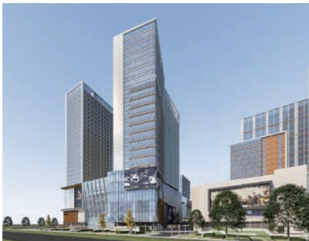
富豪國際新都薈之商業大樓/寫字樓(*)