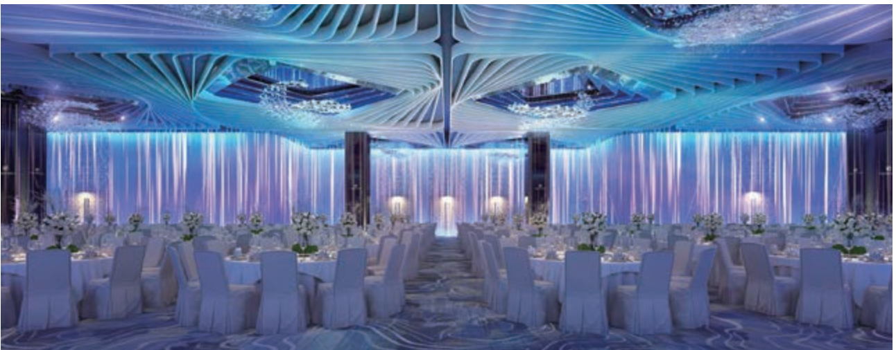
麗豪航天城酒店之宴會廳(*)