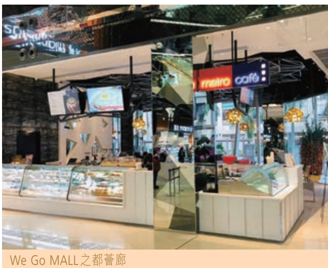
We Go MALL之都薈廊