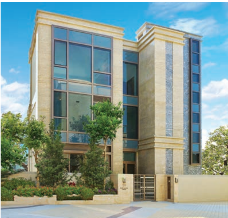
富豪 • 悅庭之豪華花園洋房