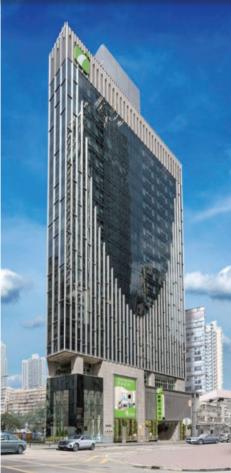
富蒼旺角酒店 — 位於九龍大角咀晏架街2號