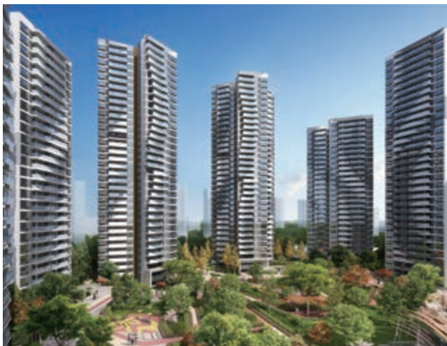
富豪國際新都薈富豪公館(第二期)之住宅大樓(*)