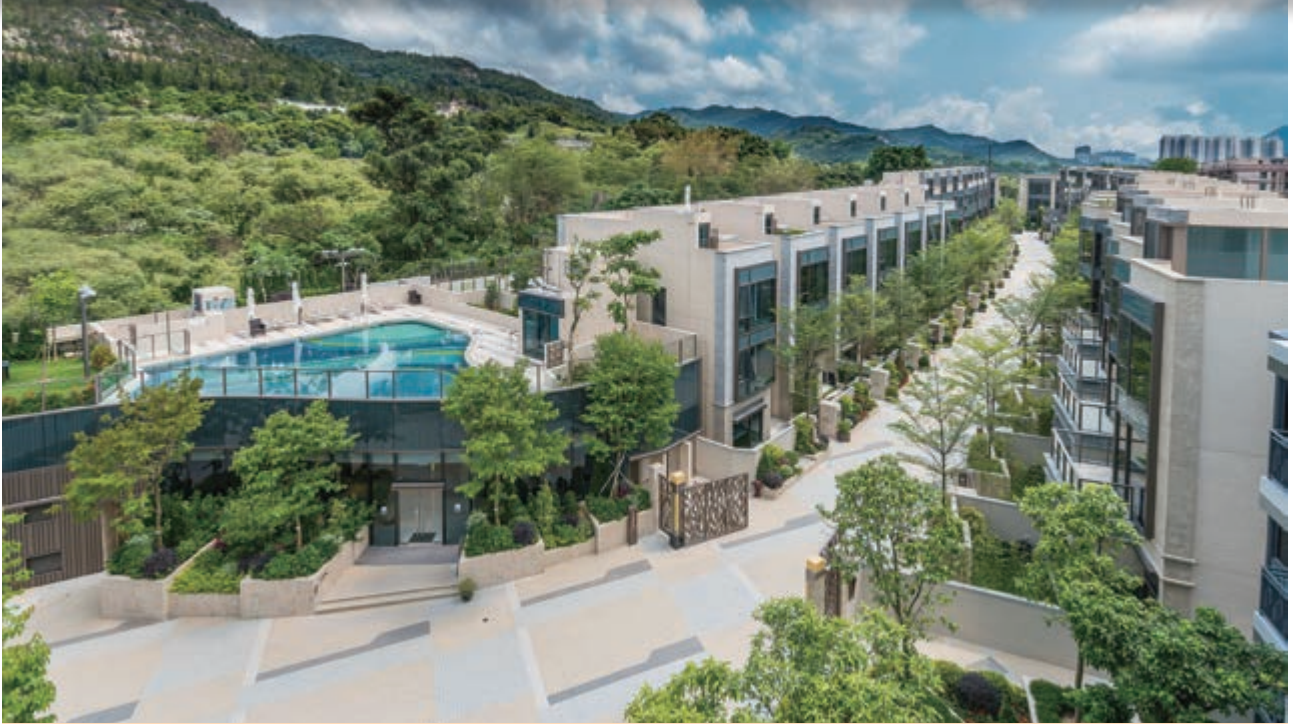
富豪 • 悅庭 — 位於新界元朗丹桂村路65至89號之住宅發展項目之花園洋房