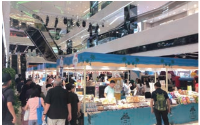
We Go MALL之Aloha市集