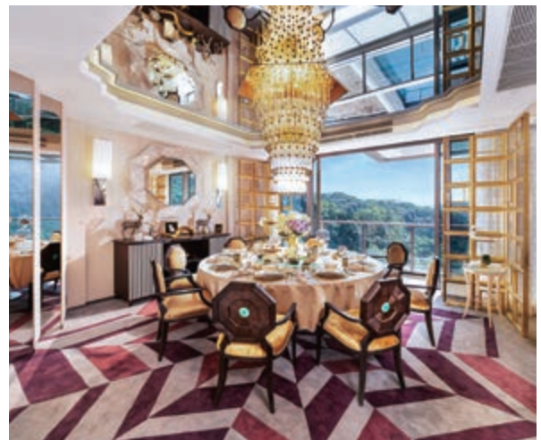
富豪 • 山峯之花園洋房的飯廳