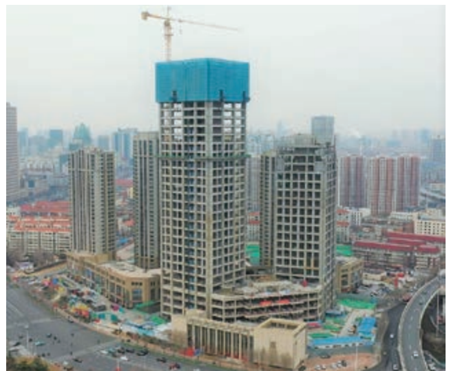
寫字樓大樓及商業平台 — 上蓋建築工程現正進行中