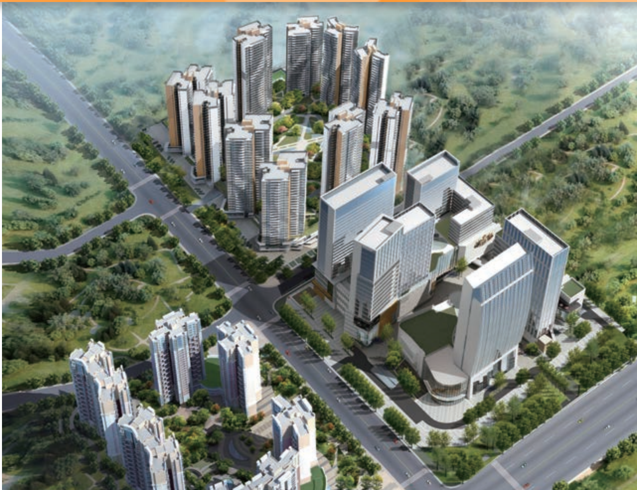
富豪國際新都薈 — 位於四川成都新都區之酒店/商業/寫字樓/住宅綜合發展項目(*)