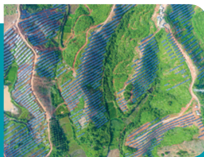
安徽省金寨縣集中式光伏發電站