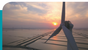
山東省濱州風力發電站