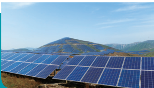
河南省淇縣廟口集中式光伏電站

年內，本集團的集中式光伏發電業務通過自獨立第三方收購業務，及自主開發及建造光伏發電站穩步發展，自本集團集中式光伏發電站所產生的電力銷售錄得營業收入約2,494.9百萬港元(二零一八年：約2,346.9百萬港元)，佔本集團年內總營業收入的39%(二零一八年：34%)。