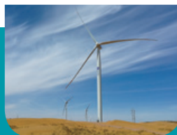
內蒙古自治區阿拉善盟風力發電站

在(其中包括)投資、開發及管理風力及其他發電業務方面的專業知識，本集團對擴展其風電業務，貢獻力量建設中國的綠色未來抱持樂觀態度。