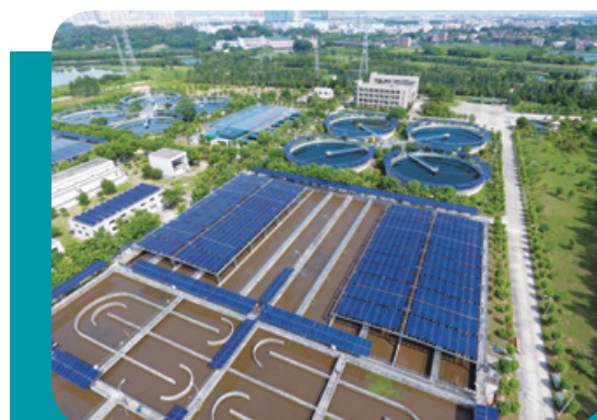
廣東省東莞北控水務集團水廠內的分佈式光伏發電站

就分佈式光伏發電業務而言，於二零一九年十二月三十一日，本集團所持有及／或管理且已營運的分佈式光伏發電站的總裝機容量超過600兆瓦，主要分佈於國家發改委劃分的III類資源區（如河南、安徽、山東、江蘇及河北等省份），當中包括本集團在北控水務集團有限公司之若干水廠建造並向有關水廠出售電力的分佈式光伏發電站。年內，來自本集團分佈式光伏發電站的電力銷售營業收入達約390.0百萬港元（二零一八年：約289.6百萬港元）。