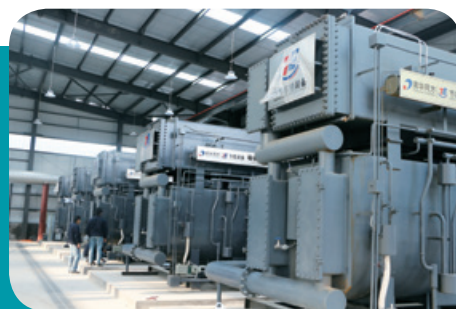
寧夏回族自治區銀川市清潔化燃煤及發電站餘熱能源集中供暖項目

年內，本集團計劃通過收購來發展水電業務。有關收購的進一步詳情載於「附屬公司及聯營公司的重大投資、重大收購及出售」附註(a)。