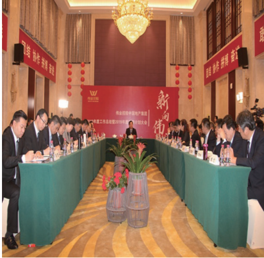
本集團2019年戰略規劃會