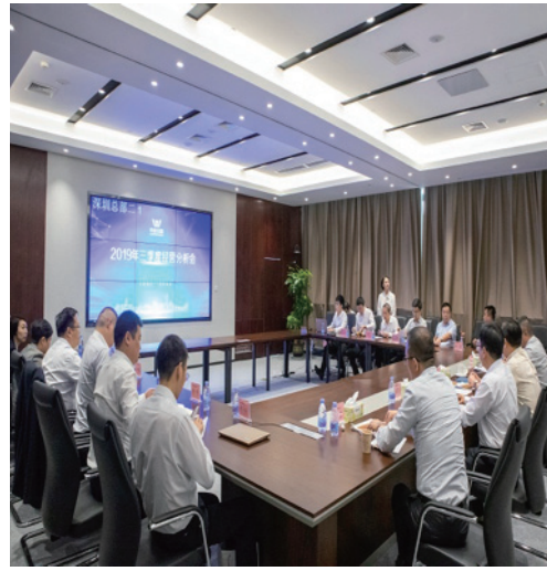
本集團2019年第三季度運營討論會