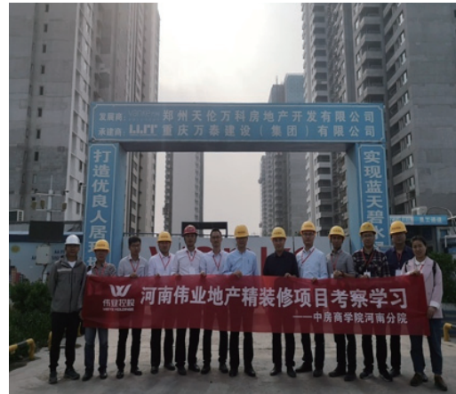
外部培訓－當地建設機構實地考察