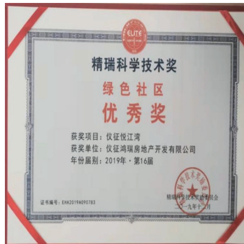
有關中華人民共和國社會力量設立科學技術獎項下精瑞科學技術獎的殊榮