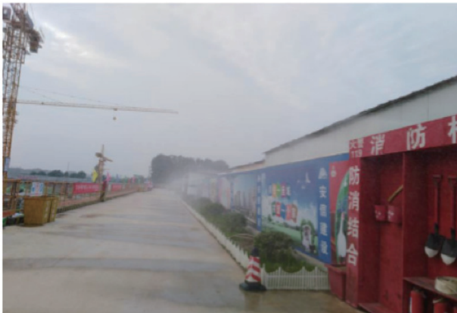
前期圍擋、噴淋及消防設施

本集團的建築和住宅污水排放嚴格遵循國家及地方標準，污水在排入市政污水管網之前已經過沈澱處理。為減少揚塵，我們採用濕作業方式開展地面工程，定期灑水，並以瀘塵物料覆蓋工地。我們對實時空氣污染指數進行監控，在廢棄物的存放和處理方面，我們將建築廢棄物放置於特定區域並進行分類，以便採取措施管理不同類別的廢棄物，並在可行的情況下回收再用。針對化學品等有毒材料及油料，我們會對儲存地進行防漏和防滲處理。我們要求廢棄物清運單位需獲取運輸許可；運輸車輛均由掩蓋物完全覆蓋，以防止運載途中廢棄物溢出及粉塵飛揚；工地入口設置清洗設備，以確保進出車輛經過清洗。為降低施工期間噪聲對周邊環境的影響，我們不僅以密網覆蓋施工中的建築物外牆，還遵照相關標準測量工地噪聲水平，並將施工場地的日間噪聲水平嚴格控制在標準限值內。