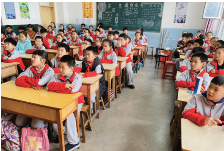
益行北控綠色種子計劃

北京北發生態建設有限公司二零一九年自主投資，承建河南省南陽市鎮平縣曲屯鎮安窪村污水處理工程，支持當地政府扶貧的民心工程。該工程處理規模：30噸／日，主要工程包括安窪村近200戶農村家庭污水管網建設、污水收集、污水處理等內容，出水水質要求達到《城鎮污水處理廠污染物排放標準》(GB18918-2002)一級A標準。改善了當地農村人居環境，提升農村生態文明建設水平，被鎮平縣政府列為美麗鄉村、精準扶貧的樣板工程。