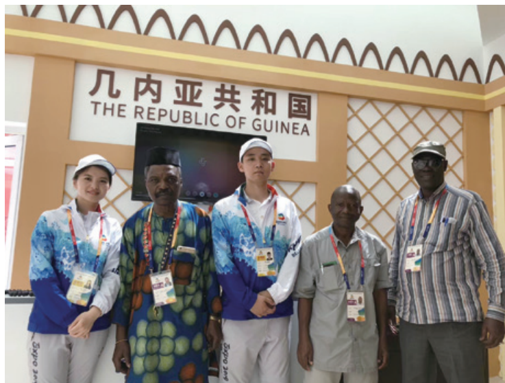
北京世園會志願者活動