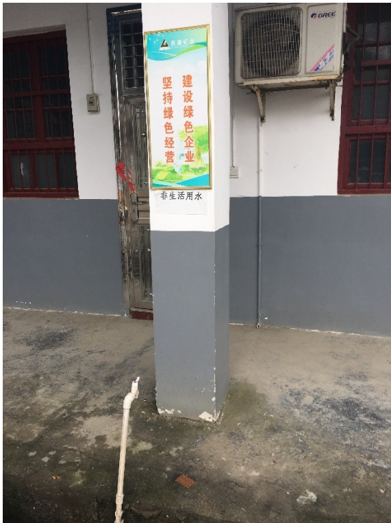
▲廠區內放置綠色標語致力建設綠色企業