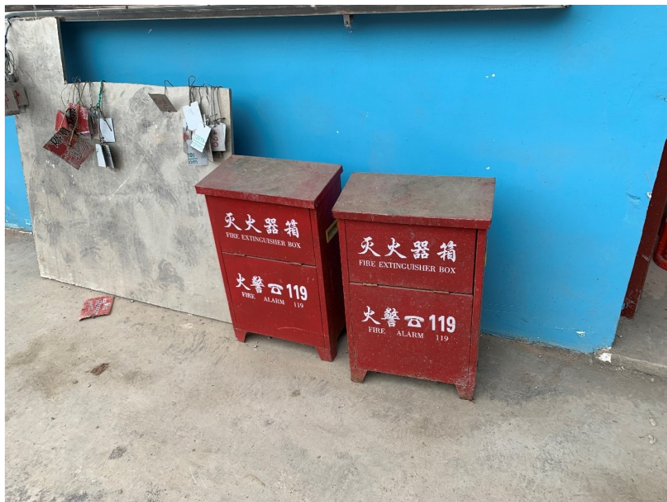
▲礦區內設置消防設備

中毒及窒息危害：採礦生產過程中引起中毒及窒息危害的原因主要為爆破後所產生的炮煙，而其他有毒有害氣體及煙塵包括：礦體氧化形成的硫化物與空氣的混合物，及於溶洞、採空區、巷道中存在的有毒氣體。礦山採用分區開採，設有分區通風系統，並選取中央抽出式通風。湖南西澳已制定《通風防塵管理制度》，要求生產技術部、安環部及礦區機電管理單位嚴格遵守。