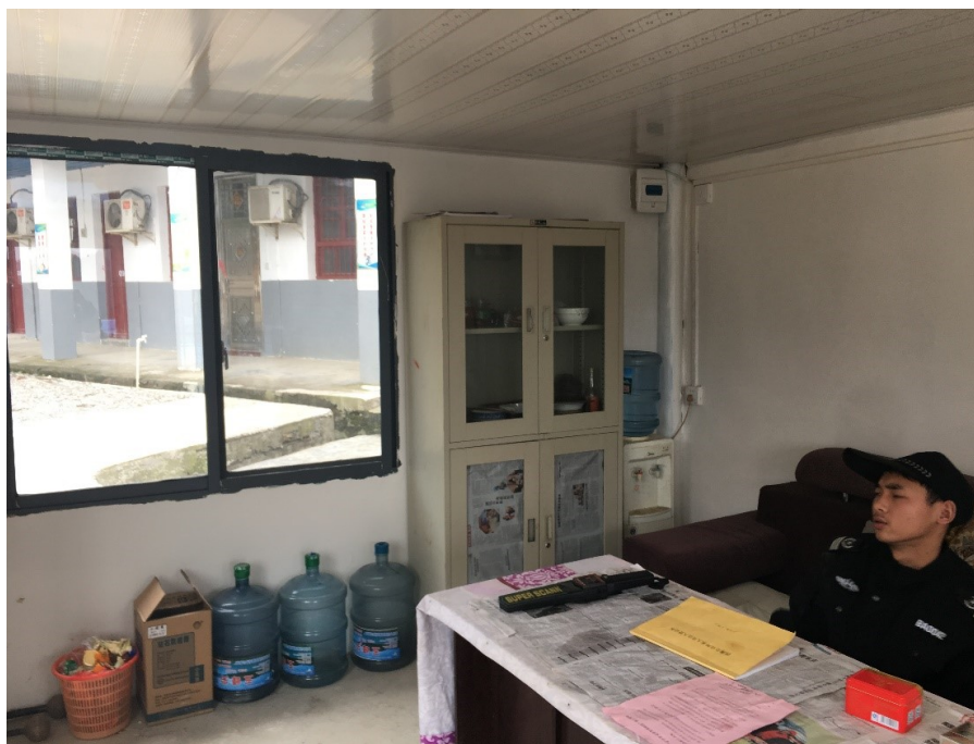
▲礦區內設置保安值班室並由保安員 24 小時值班

為全面貫切“安全第一，預防為主，綜合治理”的安全方針，加強安全生產培訓管理，湖南西澳規範了安全生產培訓秩序，以保證安全生產培訓質量的同時亦促進安全生產培訓工作健康發展。湖南西澳亦根據中華人民共和國安全生產法、安全生產培訓管理辦法（安監總局 44 號令）及有關法律、行政法規的規定，同時結合公司安全生產的實際狀況，有規劃、有目的、有重點的提供安全教育培訓和進行安全操作技能培訓工作，以提高公司全員安全素質、意識和自我保護能力。