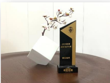
2019 年度傑出 TMT 公司 頒獎機構：華夏時報