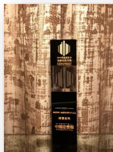
2019 卓越競爭力金融科技影響力企業 頒獎機構：中國經營報