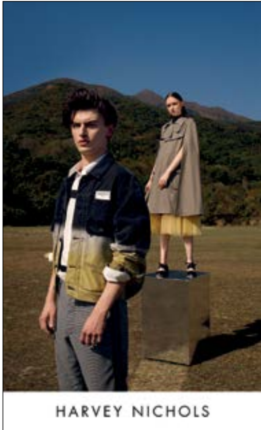
Fashionwear at Harvey Nichols. 於「Harvey Nichols」的時裝。