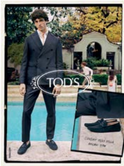
Shoes by Tod's. 「Tod's」鞋履。