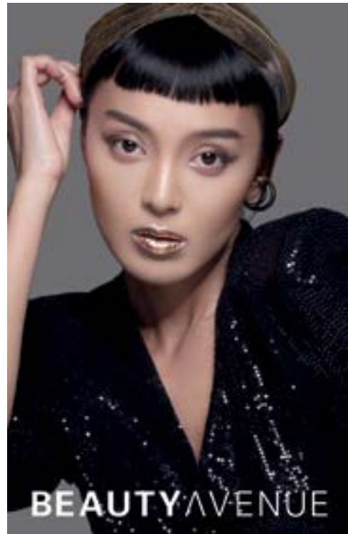
Cosmetics and beauty products at Beauty Avenue. 於「Beauty Avenue」的化妝及美容產品。

2019新冠狀病毒疫情為近幾十年來所發生事件中對全球經濟造成最嚴重衝擊之一。在香港，本地生產總值於二零二零年第一季錄得有史以來最大之跌幅，按年收縮達百分之八點九。與此同時，二月至四月之失業率飆升至百分之五點二，為十多年來之冠。加上對收入、財富及資產價格之負面影響，以及旅遊業之完全停頓，2019新冠狀病毒疫情促使香港零售業錄得有史以來最嚴峻之銷售跌幅。本集團預期在可預見之將來，香港零售市場將持續極度低迷，因我們預期在經濟復甦之前，本地消費情緒將非常低落。同時，我們預期在可預見之將來，旅遊業將不會大規模復甦，即使檢疫隔離及保持社交距離措施完全取消，遊客仍需要一段時間才能重拾安全感而恢復旅遊。鑒於上述情況，我們預期要回復至2019新冠狀病毒疫情之前的水平，將是一條極其緩慢及漫長之路。事實上這是本集團有史以來面對最具挑戰性之市場狀況。