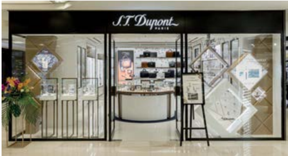
Newly opened S.T. Dupont boutique at Breeze Center, Taipei, Taiwan. 位於台灣台北市微風廣場新開設的「都彭」精品店。