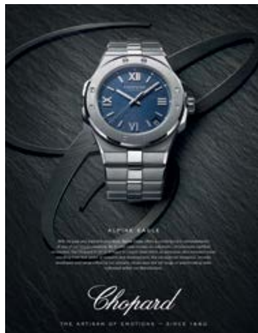
Chopard 'ALPINE EAGLE' watch. 「蕭邦」的「ALPINE EAGLE」腕錶。