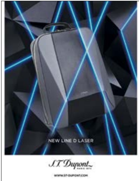
S.T. Dupont 'LINE D LASER COLLECTION' leather goods. 「都彭」的「LINE D LASER COLLECTION」皮具。