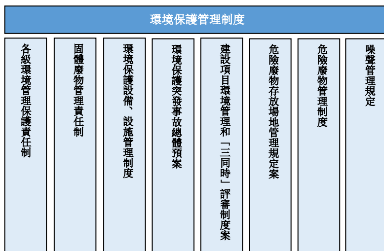
圖一 環境保護管理制度

本集團既重視經濟效益，也注重企業社會責任，安全環保部作為本集團環境管理工作的執行中樞，主要的工作包括建立各項環境保護管理制度及體系、執行標準規範、制定環保工作計劃等，並負責督促各部門的環保工作的執行。為了加強環境保護，本集團持續投入巨額專項資金，對生產線的環保設施進行升級改造，並依法處置危險廢物和一般固體廢物，用實際行動保證達標排放。於本報告期內，本集團依法依規完成了碳排放指標核定、排污權購買、環境保護稅完稅等相關工作，且沒有違反與廢氣及溫室氣體排放、向水及土地的排污、有害及無害廢棄物的產生相關並對本集團有重大影響的法律法規。