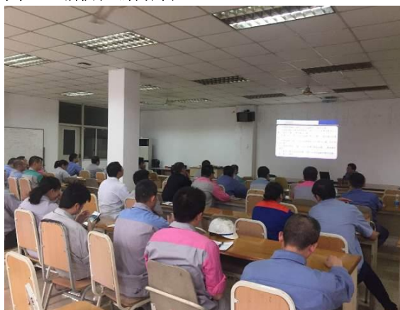
圖五 消防知識培訓