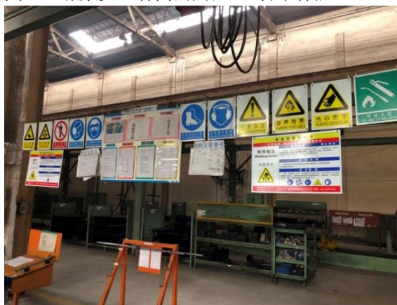
圖三 職業安全有關的用品 - 警示標誌