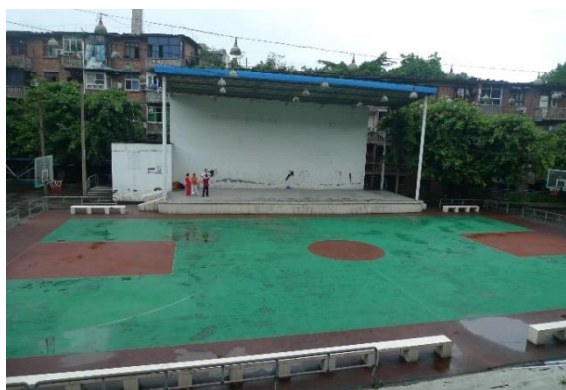
圖九 提供文化場地

本集團制定了《慈善與公益活動管理辦法》，對慈善與公益活動的資金來源、資金管理、主要活動形式、活動總結與宣傳、活動評估等進行了詳細規定。於本報告期內，本集團向社區提供文化場地，使社區人士亦能使用設施。