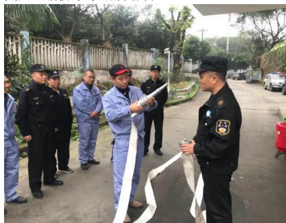
圖六 消防水帶鋪設培訓