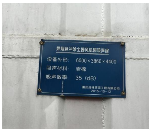
圖二 物理隔聲措施 - 吸聲房