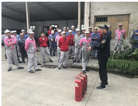
圖七 講解滅火器的使用方法及注意事項