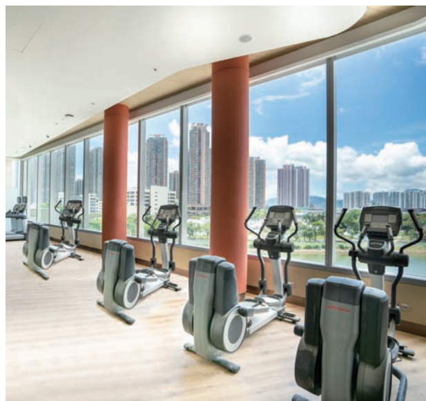
≡ 照片(上圖)攝於2020年4月29日及兩張照片(下圖)攝於2020年6月19日。該等照片已使用電腦影像技術進行編輯及處理。