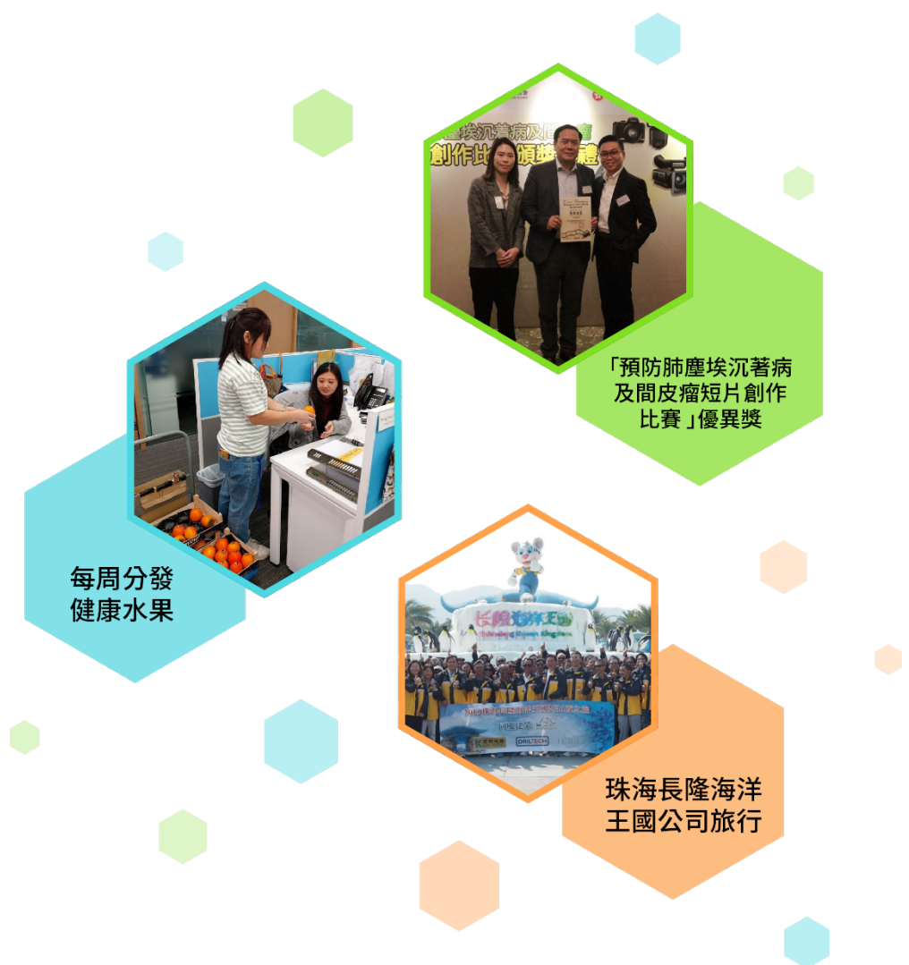
每周分發 健康水果

另一方面，為提高大眾對職業健康和安全的認識，本集團於報告年度中參與由肺積塵互助會舉辦的「預防肺塵埃沉着病及間皮瘤短片創作比賽」並獲得優異獎。