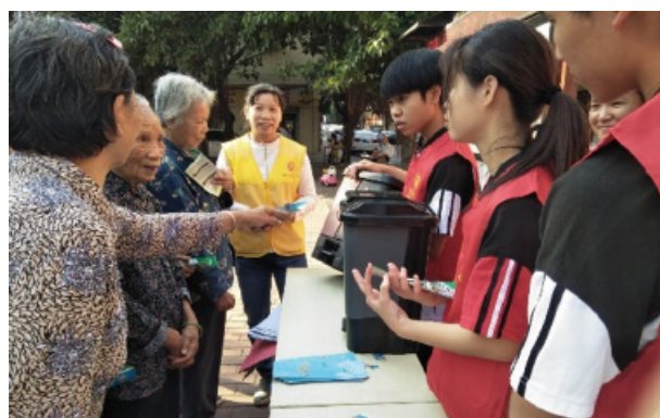
垃圾分類宣傳活動