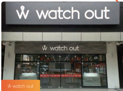
w watch out