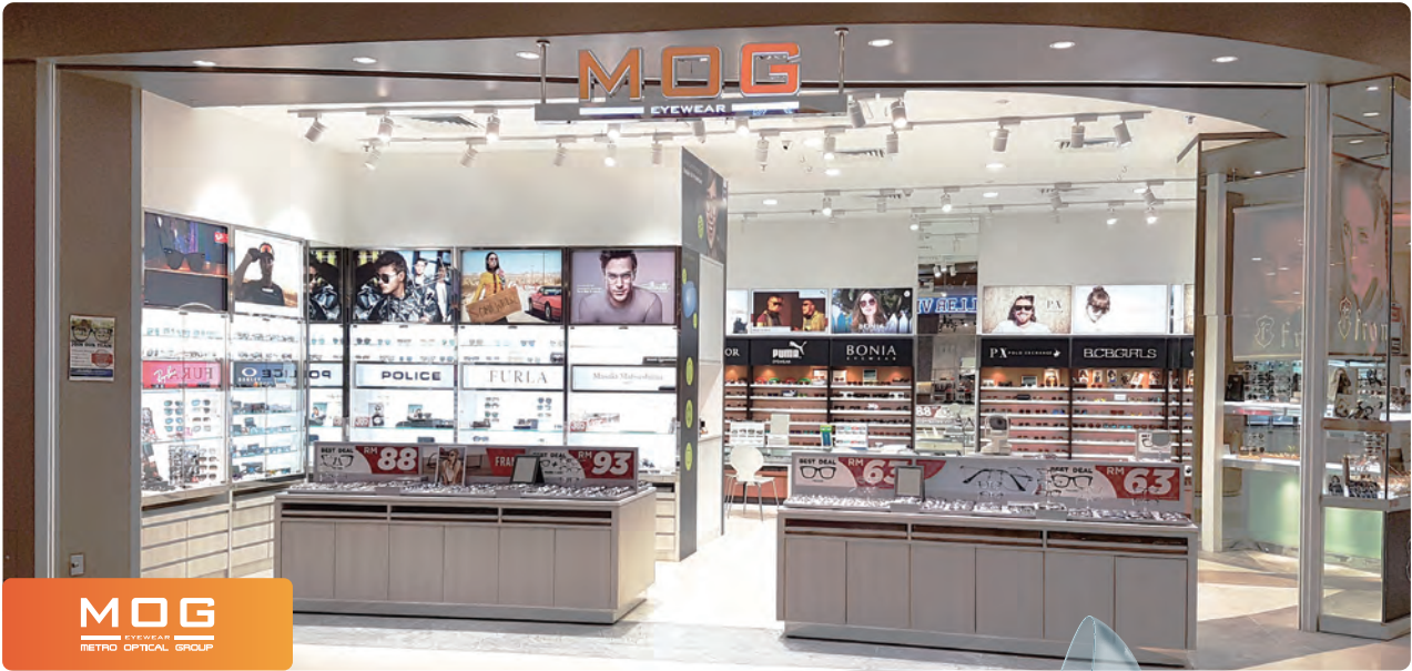
MOG EYEWEAR METRO OPTICAL GROUP