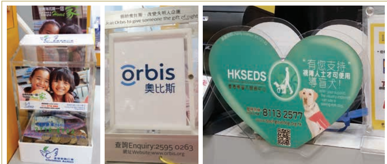
本集團於指定店舖擺放各非牟利團體捐款箱，非牟利團體包括香港導盲犬服務中心、基督教勵行會、奧比斯及國際小母牛香港分會等。