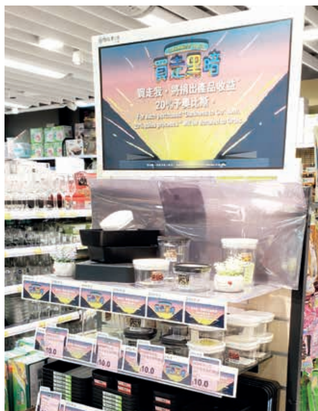
本集團參與由奧比斯主辦的奧比斯世界視覺日「買走黑暗」活動。