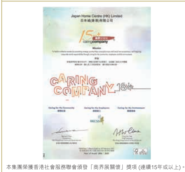
本集團榮獲香港社會服務聯會頒發「商界展關懷」獎項(連續15年或以上)。