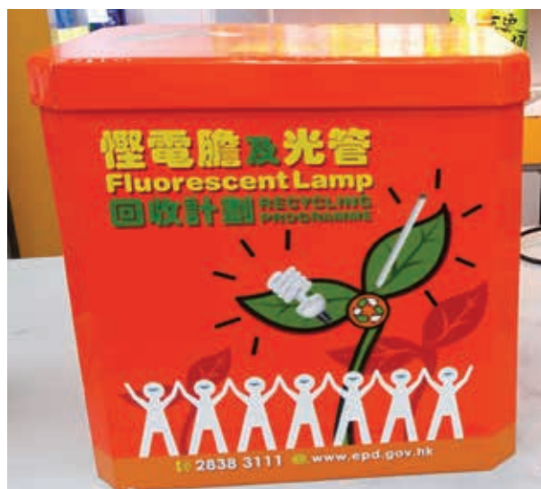
本集團參與環保署舉辦的「慳電膽及光管回收計劃」，於指定店舖放置回收箱。