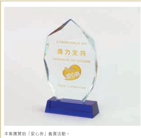
本集團贊助「愛心券」義賣活動。