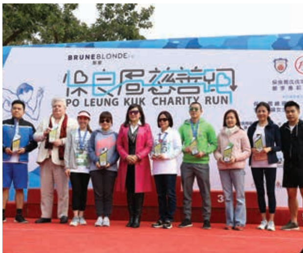
本集團贊助及參與保良局慈善跑。