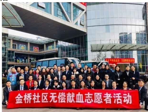
我們的義工參與流動捐血計劃