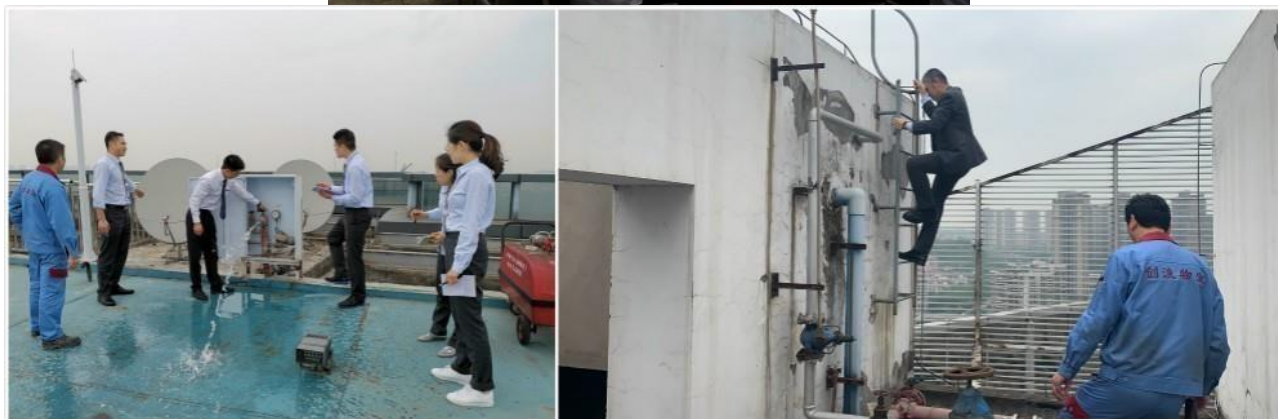
重慶辦公室舉行的消防安全培訓

除了保持工作場所安全，本集團亦提倡員工福祉。為了保持潔淨衛生的工作環境，我們在香港辦公室安裝了濾水器和空氣淨化器，並提醒員工時刻保持辦公場所整潔。在中國內地的業務地區，我們採取了不同的措施鼓勵員工更注重健康生活。我們為深圳辦公室的員工提供符合人體工學的座椅。在本報告年度，我們在重慶辦公室舉辦了一場有關預防近視的研討會，以提升員工對視力保健的關注。