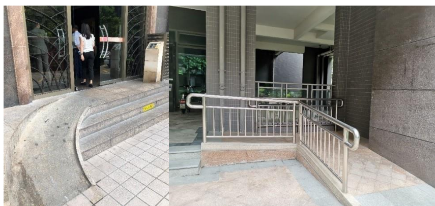
安裝在城市天地廣場（圖左）和雅瑤綠洲（圖右）的增設斜道

集團相信好的建築設計應該包含社會共融元素，不同人士的需求也應該被考慮。有見及此，我們在所有物業安裝了無障礙設施，以提供無障礙通道。例如，我們在出入口增設了斜道，以方便肢體殘障人士及推嬰兒車的使用者。