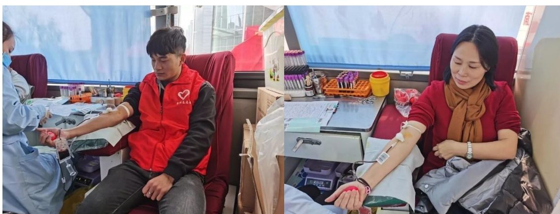
捐血者於流動巴士捐贈血液