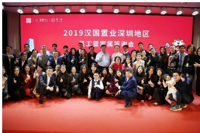
深圳辦公室為員工及其家人舉辦了聖誕及答謝晚宴