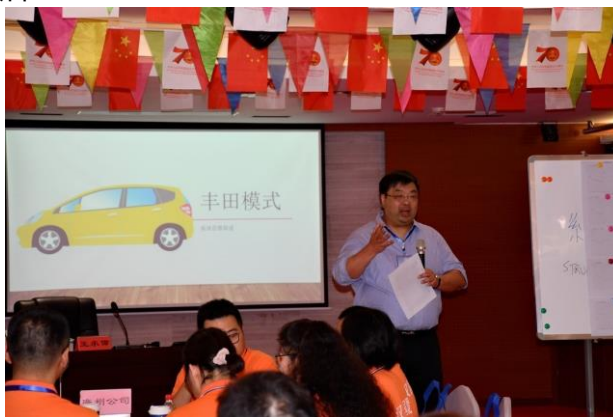
各個營運地區管理層員工參與由集團董事主講的「豐田模式」管理培訓課程

此外，本集團預留充足的財務資源，以資助僱員申請獲認可的技術及專業機構的會員資格，其中包括提供保安服務、操作高或低壓電氣設備或履行會計和財務職責而需要持有的會員資格等。透過以上資助，我們不但鼓勵員工培養自身的專業資格，更能將其專業知識學以致用至企業營運之中。