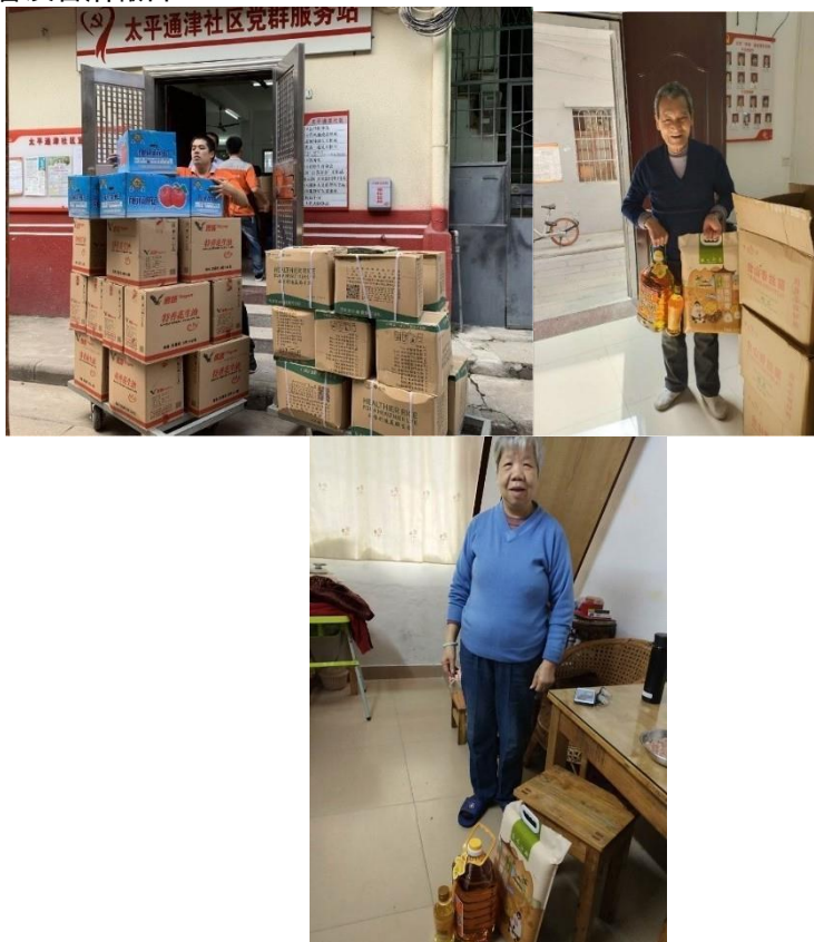
在廣州，我們的義工向獨居老人分發各項生活雜貨，如大米、食用油和水果等

在香港，我們的義工團隊舉辦了探訪鄰近康老中心的活動，如保良局華永會生命教育及長者支援中心以及香港紫雲間雋逸護養院等。在探訪期間，我們向長者派發抗疫物資包，以幫助他們預防感染新型冠狀病毒肺炎。