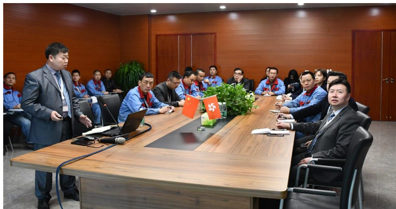
集團舉辦「供電設備管理與維修」培訓班，以培養重慶辦公室的工程人才

為促進員工獲取更多知識和完善個人發展，本集團為員工提供了多元類型的培訓機會。所有新入職員工將接受在職培訓。中國內地業務為新入職員工組織了入職培訓，以加強他們對企業文化和道德操守要求的了解。此外，我們還組織各項培訓活動，藉此提高員工的知識及技能。在 2020 年間，集團分別在香港及中國內地辦公室舉辦了培訓活動。