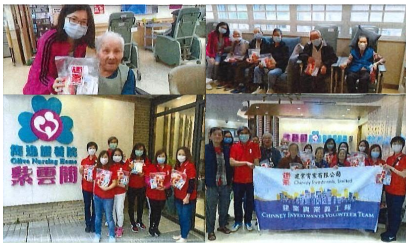
我們的義工探訪紫雲間雋逸護養院並向長者派發抗疫物資包

在香港，我們的義工團隊舉辦了探訪鄰近康老中心的活動，如保良局華永會生命教育及長者支援中心以及香港紫雲間雋逸護養院等。在探訪期間，我們向長者派發抗疫物資包，以幫助他們預防感染新型冠狀病毒肺炎。