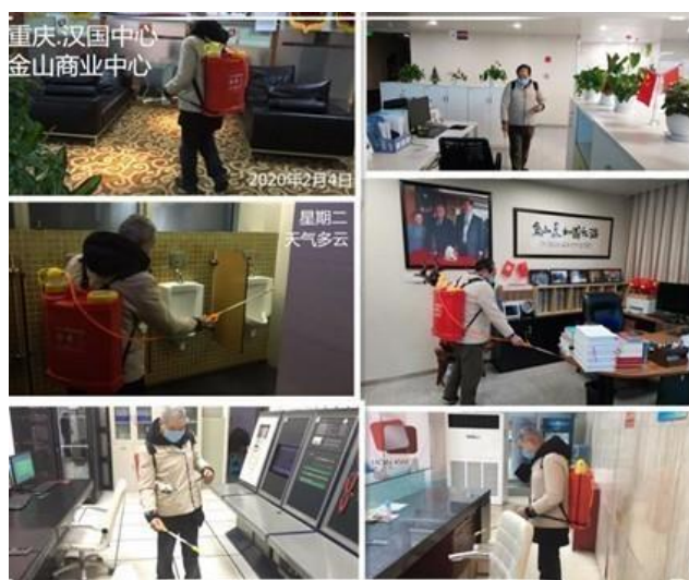
員工為重慶物業進行每日消毒工作

自 2020 年初起，我們與社區攜手努力，以應對新型冠狀病毒肺炎疫症大流行。例如，我們在重慶兩江新區成立了一支防疫義工團隊，並捐贈合共人民幣 100,000 元。除了於旗下物業採取如消毒和體溫檢測等不同措施，我們的義工更協助管理當地 20 多家物業管理公司運送、儲存和分配各種防疫物資，促使社區充分準備預防大流行疫病。