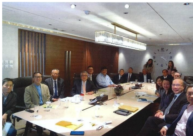
集團各個公司的董事參加「香港上市規則」培訓課程