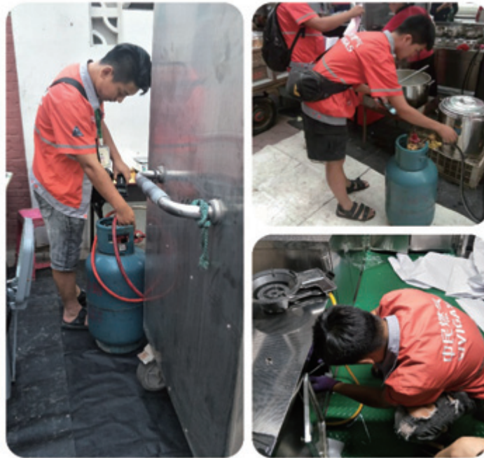
配送人員檢查客戶的用氣設備

我們要求負責部門對所有用戶地點及戶外的管道進行定期檢查，確保管道沒有洩漏的情況，以避免突發事件。而且我們會教育用戶有關管道燃氣及罐裝燃氣的安全使用指引，提高他們安全意識，一旦發現異常情況，需立刻通知我們，我們便迅速派技術人員到現場檢查和作出適當處理。對於所有安全檢查，負責部門需詳細記錄，定期向管理層報告。