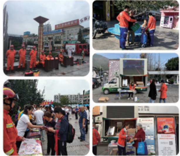
不同形式的安全用氣宣傳活動

燃氣安全是全社會的共同責任，為了避免任何安全事故的發生，本集團積極與政府、媒體、社區等各個層面合作，以多種形式廣泛地進行安全用氣宣傳，包括宣傳資料(安全用氣手冊)派發、使用者諮詢、標語、電影、幻燈片、報告、講座、黑板報、簡報、展覽、參觀、現場會等。我們的安全管理部門負責組織安全宣傳活動，包括每年的全國「安全生產月」、主要節假日、季節性宣傳、不定期的專題宣傳及「安全生產競賽」等。我們亦設立24小時搶險熱線，讓居民用戶能夠即時獲得安全專員的指示，及時將事故風險降至最低；如果發生任何事故，我們亦能夠獲得第一手資料，配合當地消防部門儘快處理事故，避免事故影響進一步擴大。