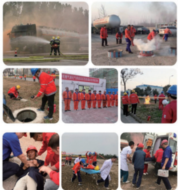
搶險、消防及急救演練

洩漏燃氣可引致安全事故，對員工及市民可造成嚴重後果，因此從生產至售後服務的不同階段，我們制定了相應的管理制度與操作規程，包括風險管理手冊、日常生產安全管理、工程建設安全管理、氣站安全管理、消防安全管理、氣罐裝卸與安全操作規程、安全行駛操作規程、安全檢查制度、天然氣用戶管理、用戶報修服務管理、安全事故管理等，以減少安全隱患及避免安全事故發生。為了貫徹落實「安全第一、預防為主、綜合治理」的安全生產方針，規範應急管理工作，提高應對風險和防範事故的能力，儘量減少人員傷亡及對環境和社會帶來負面影響，並確保應急救援工作有效，本集團制定生產安全事故應急預案，建立處理事故的架構及訂明相關責任，辨識危險源，評估風險，分析事故發生的可能性及其後果的嚴重性，然後為各種重大事故制定不同的應急預案，內容包括負責人、預防事故的措施、事故發生後的通報、應急疏散、現場應急處理的流程與要求、維護人員安全的措施、宣傳教育、演練、獎懲制度等。