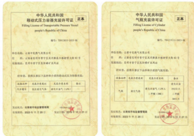
氣站營運作許可證

一間位於雲南附屬公司的氣站於上年度發生爆炸而造成傷亡，我們已按照本集團內有關的應急預案處理，並即時通報當地政府以協助有關部門處理是次爆炸事故，及後我們亦一直跟進並配合有關政府部門的調查工作，有關調查工作已於2019年6月完成，我們已就調查結果對受傷員工作出補償及當地政府部門已對事件作出相應的處分。本集團因是次事故知悉雲南附屬公司的安全管理尚未完善，我們已按照事故調查報告作出整改及採取防範措施，包括增加安全設施與更換安全設備；完善監控設施，使監控系統全面覆蓋氣站，更換報警系統，對儲罐加裝壓力及溫度監控系統；修訂安全規章制度與操作規程，組織員工安全教育培訓，加強生產現場安全監管，督促員工正確佩戴防護裝備，嚴格落實安全規章制度與操作規程，加強安全隱患排查整治工作。有關政府部門及後到現場檢查整改情況，並接受我們的恢復營運申請，我們已獲得氣站營運作許可證，有關氣站已於2019年末恢復營運。