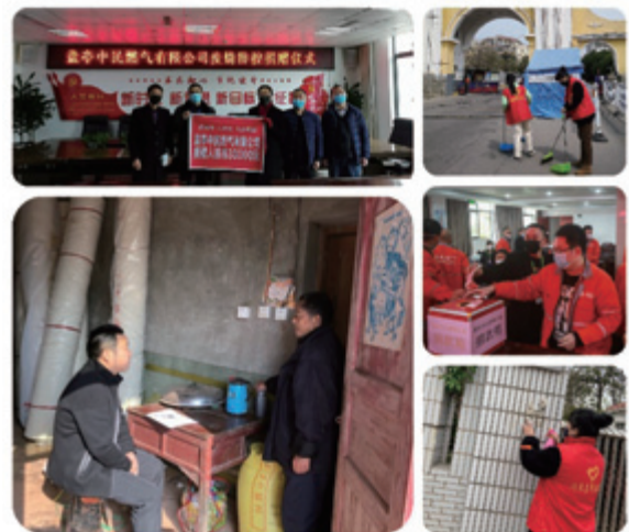
參與社區活動－疫情捐款、探訪貧困戶及清潔社區街道