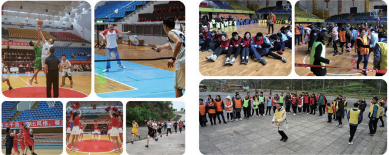
為員工舉辦的運動比賽及團建活動，以保持其身心健康

對於2020年年初爆發的新型冠狀病毒肺炎疫情，本集團沒有因疫情情況嚴重而削減員工待遇或裁減員工；為了保障市民用氣的供應，我們並沒有因此而停工，改為輪班工作，而員工如有需要亦可以申請在家工作。此外，加班工作亦須先獲得員工同意，並按照勞動法律法規給予員工補償；而為了員工健康及生命安全著想，我們採取了多項防疫措施，詳細資料請參考下文「健康與安全」部份。