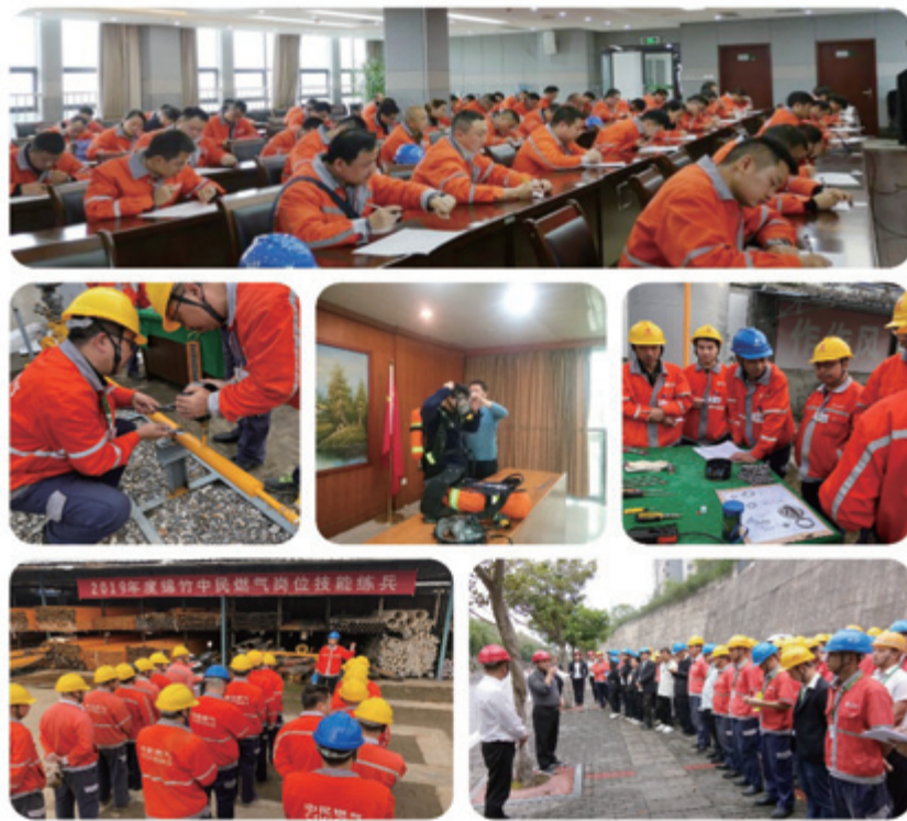
定期安全培訓與實操訓練

員工培訓、提供安全工作環境及職業健康有著密不可分的關係，本集團通過適當的職業健康與安全意識教育，為員工講解企業方針，增強大家的安全意識和自覺性、提高員工的專業技能，尤其是負責存在重大安全隱患崗位的員工，使他們能於安全的環境下履行職責；如發現事故及安全隱患，需立即向管理層報告。於本報告期內，除了為新員工提供職前培訓，我們還組織了多項安全培訓工作，如生產安全操作規程、消防安全知識與燃氣知識培訓、壓力容器操作培訓、高空與高溫作業安全及防護培訓、用電知識培訓、液化天然氣理化知識與實操訓練、危險貨物道路運輸安全管理培訓、易燃易爆場所消防安全培訓、應急預案培訓、隱患排查、案例分析與燃氣設施檢修培訓、入戶安全檢查培訓、搶險培訓、安全資格證培訓等。