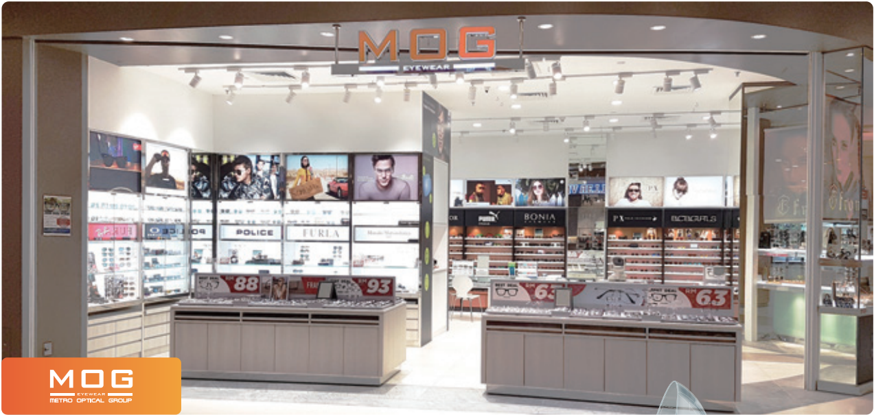
MOG EYEWEAR METRO OPTICAL GROUP