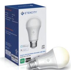
智能LED柔白 可調光燈泡