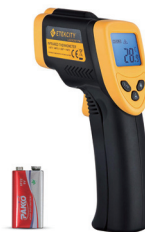
數字激光紅外 測溫儀