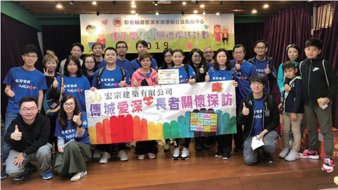
僱員在「傳城愛深 — 長者關懷探訪」活動中探訪老年人