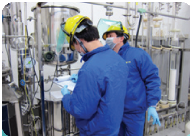
WEX Pharma 致力研發治療痛楚的創新藥物。

WEX Pharma於加拿大及美國之臨床試驗研究受2019冠狀病毒疫情影響而受阻，當情況許可下，該公司定於適當時間啟動Halneuron™的臨床試驗。同時，WEX Pharma亦繼續致力從事TTX之增值研究，如運用半合成方法生產TTX、研發提升TTX穩定性的新配方，以及發掘更多新的痛楚生物標記。