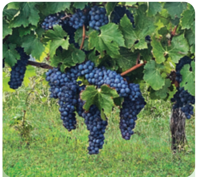
於二零二零年，長江生命科技完成收購位於南澳州省的 Jubilee Park 葡萄園及 Katnook 葡萄園。

席捲全球之 2019 冠狀病毒大致上並沒有對澳洲及新西蘭的酒業構成影響，其中之因素與葡萄酒消耗量增加有關。於二零一九年時普遍預期二零二零年的葡萄酒銷量將稍微下降，惟瓶裝酒價格上漲可抵銷有關跌幅。實際上，因疫情發生，消費者留家時間較長反而促使酒消耗量有所增加。