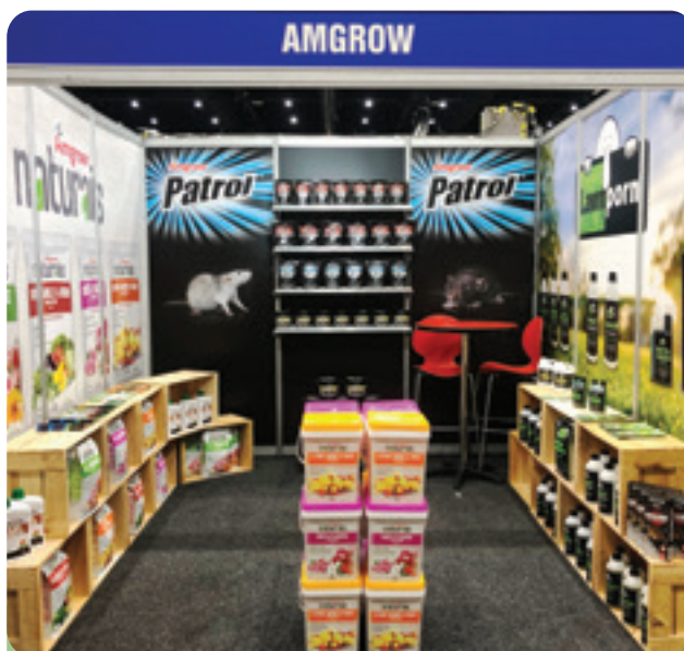
Australian Agribusiness 於澳洲經營銷售及分銷業務，在專業草地保育、滅蟲管理、家居園藝及特色農業四個市場範疇提供產品與服務。

為應對疫情所帶來之挑戰，Australian Agribusiness 繼續專注於客戶及銷售兩方面，同時實施多項有助增加盈利之措施，並提高各營運範疇的效率。