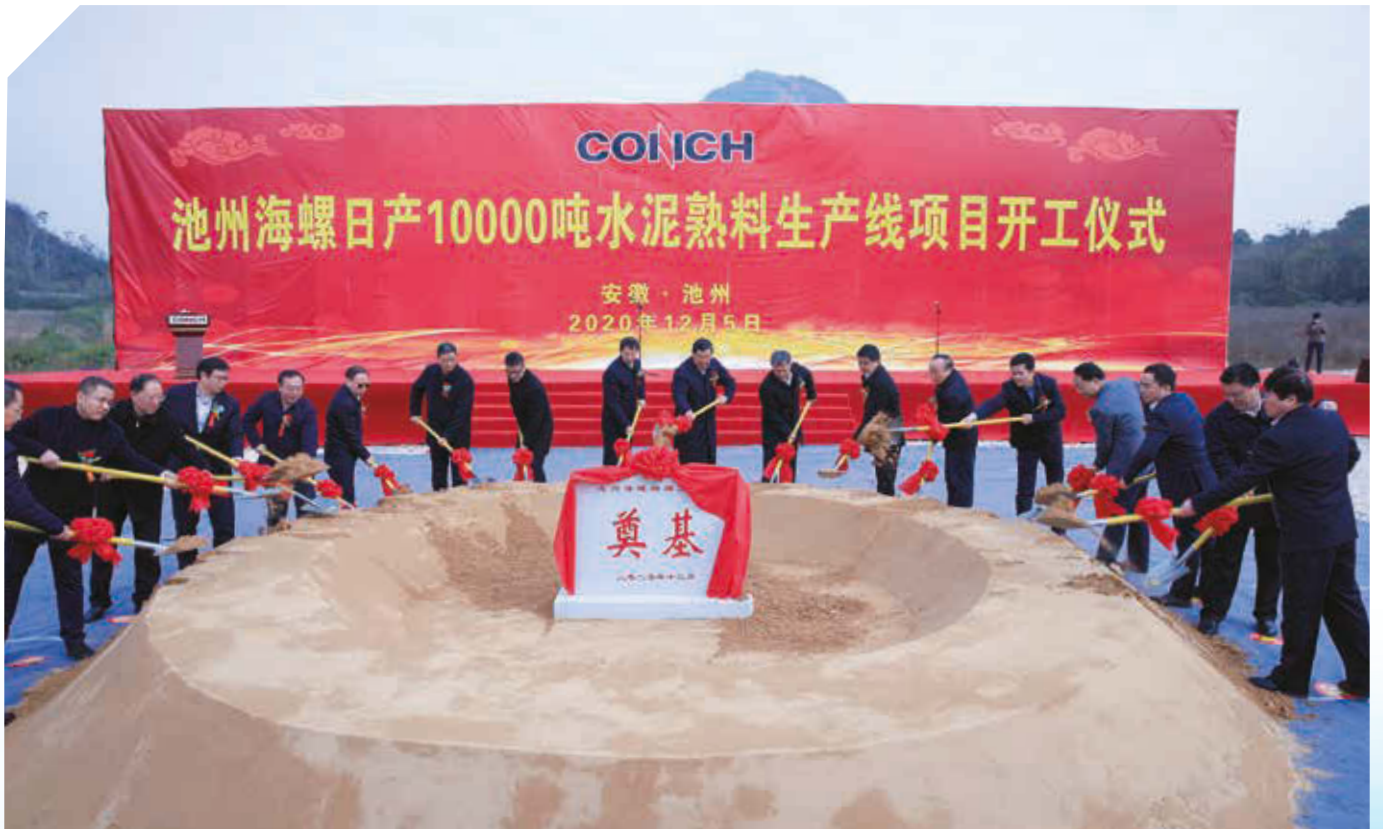
池州海螺萬噸綫項目開工儀式