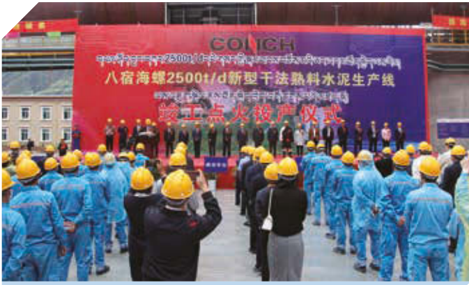
產業援藏項目八宿海螺投產儀式