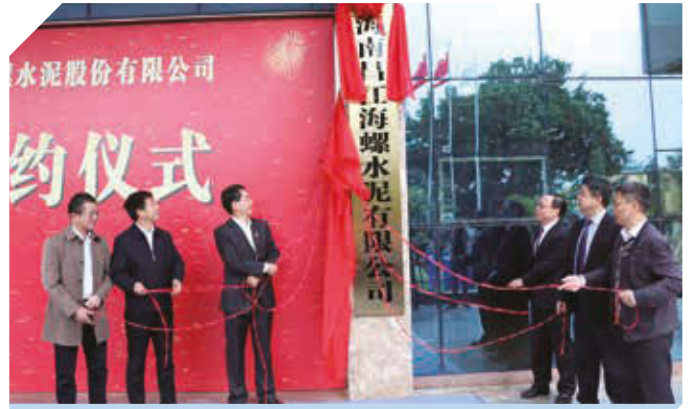
海南昌江海螺揭牌儀式