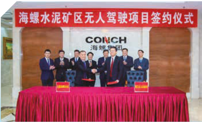
礦區無人駕駛項目簽約儀式