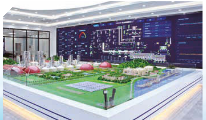
海螺水泥全流程智能化工厂控制室