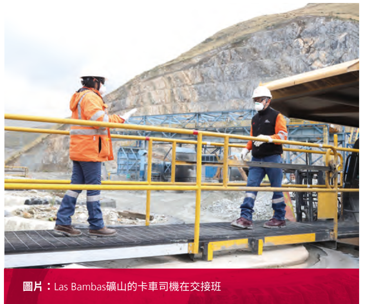
圖片：Las Bambas礦山的卡車司機在交接班