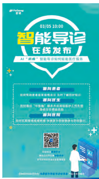
本集團智能導診產品 正式發佈

本集團同時倡導員工勞逸結合。員工除可享有國家法定假期及年假外，還享有全薪病假及家長會休假等。女性員工和青年員工還分別可以享受三八婦女節、五四青年節假期。同時，若員工有 10 周歲以下的子女，還可在當年 6 月 1 日當天享受「六一假期」。