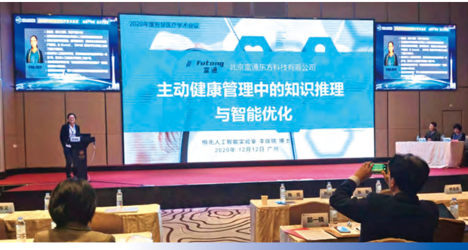
本集團參加了2020年智慧醫療學術會議以及富通AI Lab負責人李博士發表「主動健康管理中的知識推理與智慧優化」演講