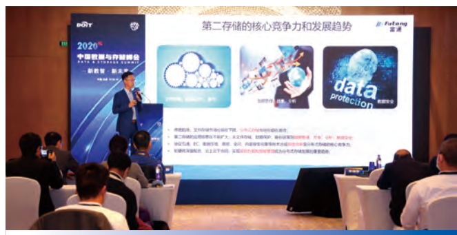
本集團參加了不同會議及論壇