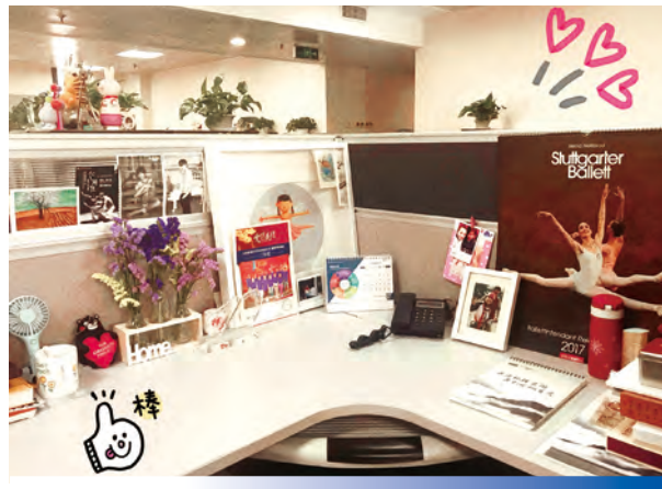
富通 2020 年最佳辦公室 座位比賽