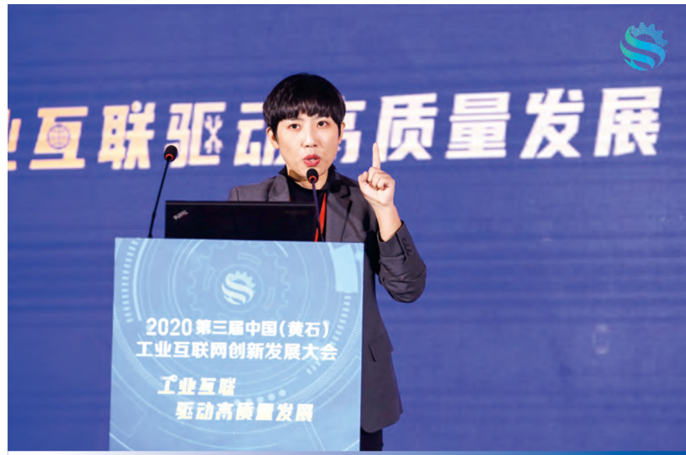
本集團參加了2020工業互聯網創新發展大會

在數字化智能產品方面，本集團之人工智能實驗室正式命名為「恆先人工智能實驗室」，並在北京和成都建立雙中心，以承包國家級及省部級的重點研發計劃課題，提高創新能力，研究AI算法，逐步擴展在各行業的應用能力。本集團亦成功獲得參與科技部「科技冬奧」重點研發計畫之「冬奧會智慧醫療保障關鍵技術」課題專案，以深度拓展醫療行業領域之技術和應用。