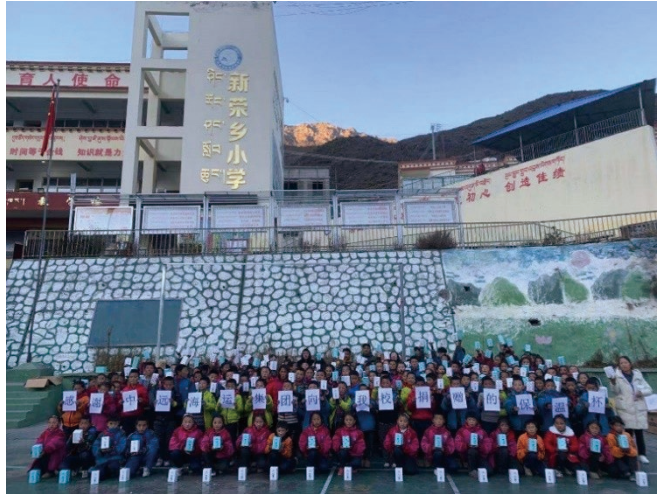
中遠海運港口向洛隆縣當地一家小學捐贈保溫杯。

本公司每年舉辦不同類型的慈善捐款活動，本年度已向中遠海運慈善基金會捐贈人民幣800萬元，以支援西藏洛隆地區脫貧工作。此計劃涵蓋5個項目，分別是資助西藏洛隆縣人民政府開展洛隆縣小學建設項目、洛隆縣臘久鄉衛生院標準化建設項目、洛隆縣幹部人才培訓項目、洛隆縣暖心保溫杯項目及洛隆縣飲用水應急供水的第二期工程項目。