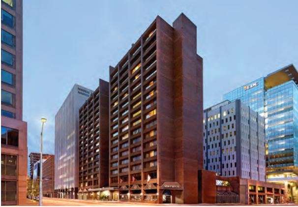
Sheraton Ottawa Hotel, Canada 加拿大渥太華喜來登酒店