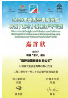
“Best Elderly Employers with Talented Elderly People Award 2020” – Excellence Award 2020年優秀長者僱員暨聘僱「耆才」僱主嘉許狀