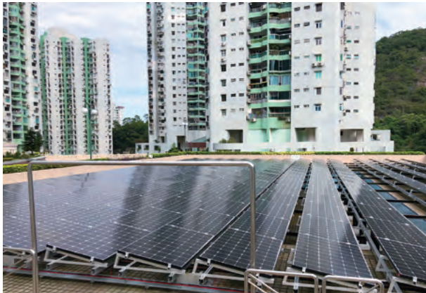
Solar Energy Equipment at Ocean Gardens 在海洋花園的太陽能設備