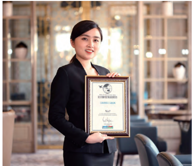
Smart Travel Asia's Best of the Decade Awards - No. 7 of Best Hotel Makeovers 《亞洲智慧旅行》十年最佳獎 - 最佳酒店改建第七名