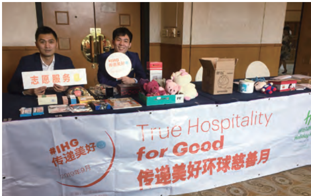
Charity Bazaar 義賣