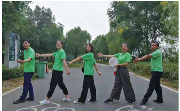
Green Walk 綠色步行