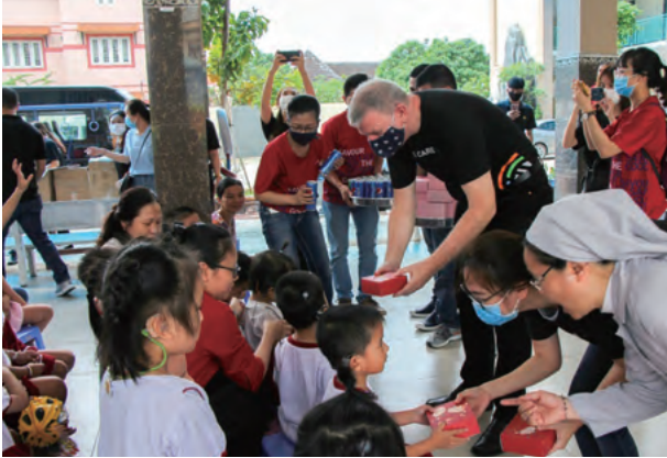
Charity trip to Be Tho Center in Dong Nai Province, home to 145 unfortunate children 同奈省Be Tho中心的慈善之旅，其中有145名不幸的孩子

Sheraton Saigon Hotel & Towers, Vietnam 越南胡志明市西貢喜來登酒店