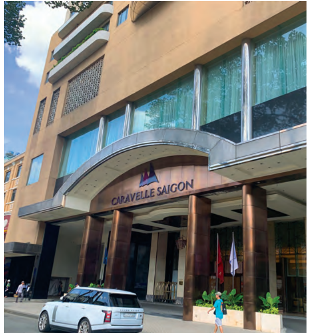
Caravelle Saigon Hotel, Vietnam 越南胡志明市帆船酒店