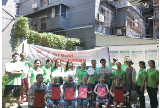
Visit Old Folk's Home 參觀舊民俗之家