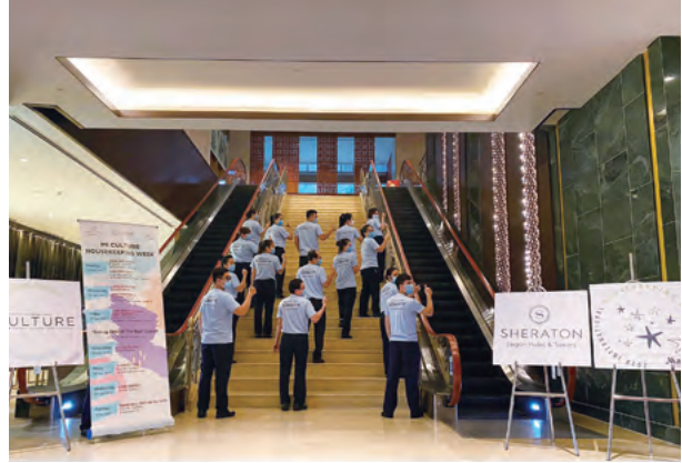
MI Culture Housekeeping Week 萬豪國際管家服務文化週

Caravelle Saigon Hotel, Vietnam 越南胡志明市帆船酒店