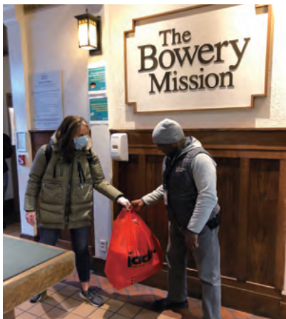
The Bowery Mission 鮑里任務