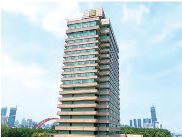
Holiday Inn Wuhan Riverside, China 中國武漢晴川假日酒店