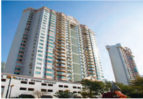
Ocean Gardens 海洋花園