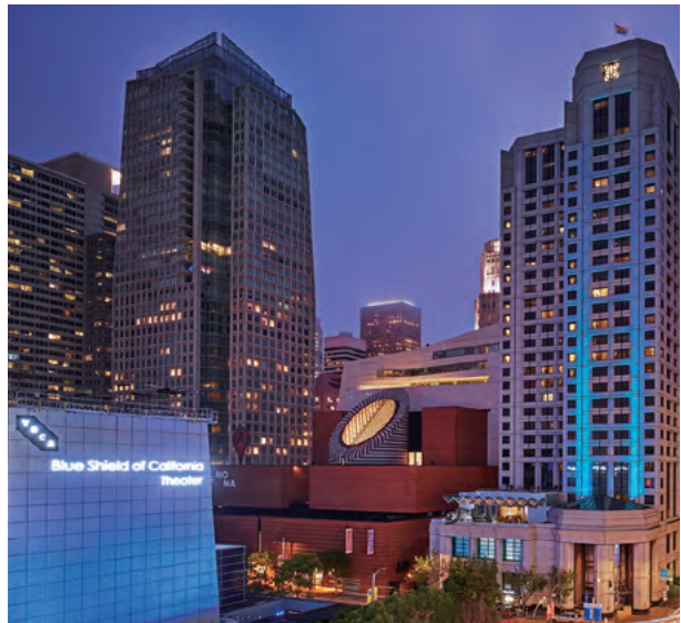
W Hotel San Francisco, USA 美國三藩市W酒店