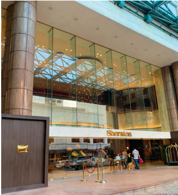
Sheraton Saigon Hotel & Towers, Vietnam 越南胡志明市西貢喜來登酒店