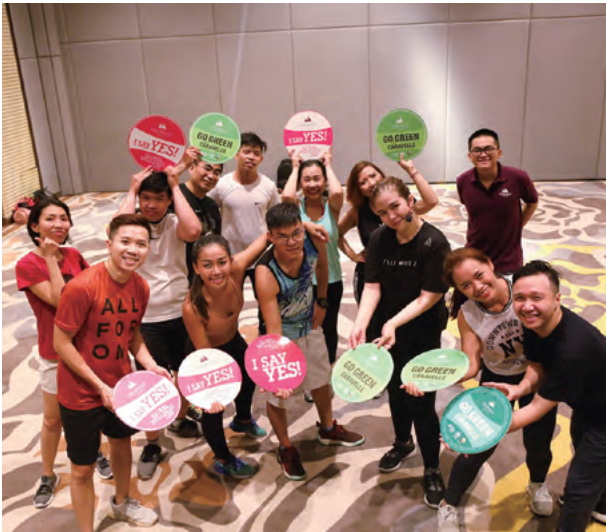
Environment & Wellness Week 環境與健康週

Caravelle Saigon Hotel, Vietnam 越南胡志明市帆船酒店