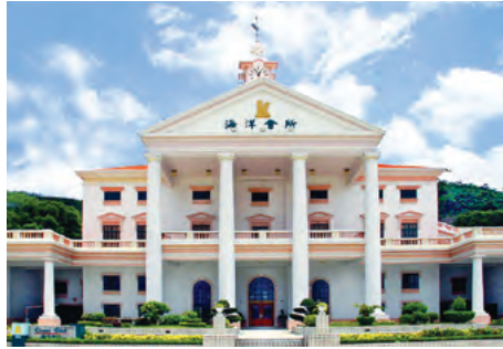
Ocean Club 海洋會所