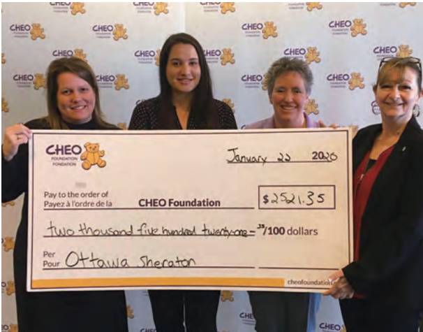
CHEO Foundation CHEO基金會

Sheraton Ottawa Hotel, Canada 加拿大渥太華喜來登酒店