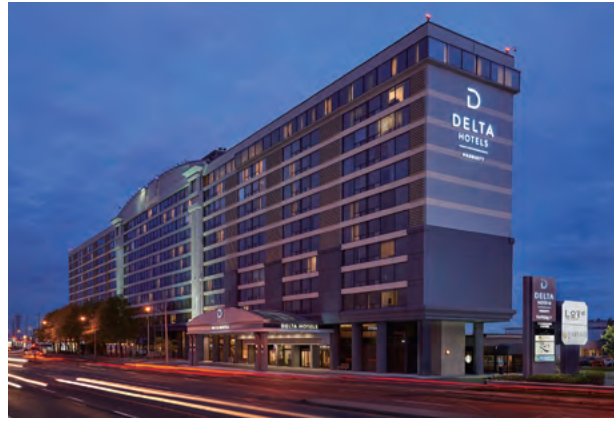
Delta Hotels by Marriott Toronto Airport & Conference Centre, Canada 加拿大多倫多機場會議中心德爾塔萬豪酒店