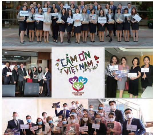
Commitment to Cleanliness in our hotels 致力於我們酒店的衛生