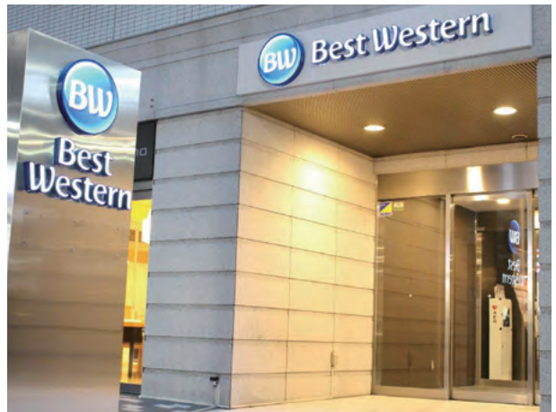
Best Western Osaka Hotel, Japan 日本大阪心齋橋西佳酒店