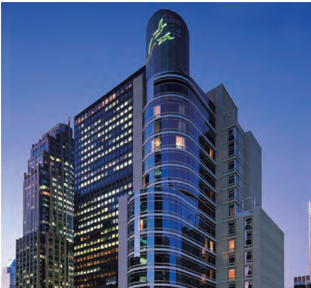
Sofitel New York, USA 美國紐約索菲特酒店