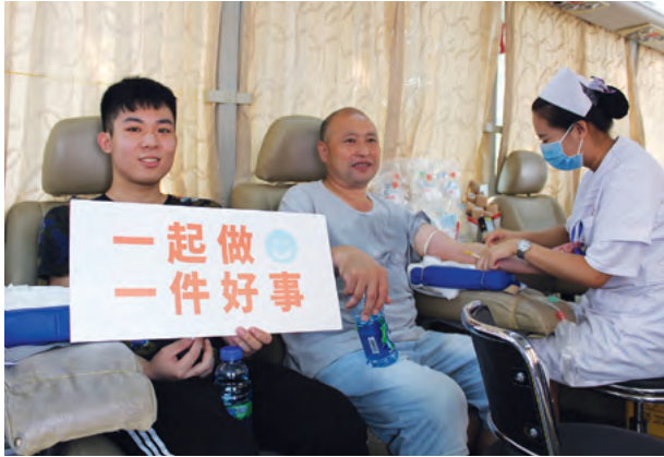
Blood Donation 捐血

Holiday Inn Wuhan Riverside, China 中國武漢晴川假日酒店