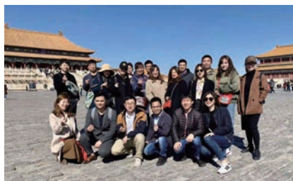
部門團隊建設活動

為吸引及挽留人才，本集團定期參加權威諮詢公司的薪酬研究活動，提供具有競爭力的薪酬，並根據市場趨勢對各崗位的薪酬進行審核。除國家法定的五險一金外，我們還為員工提供各種福利，如員工旅遊、生日聚會及禮物、中秋節禮物、結婚及生育禮金等。除國家法定節假日外，本公司員工享有年假、病假、婚假、產假、哺乳假、陪產假、喪假等各類假期。於報告期內，我們組織了聖誕晚會、下午茶聚會、羽毛球比賽、部門團隊建設活動及其他員工活動，增強員工對本集團的歸屬感。