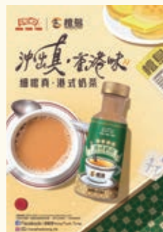
推出「鴻福堂x檀島 港式奶茶」