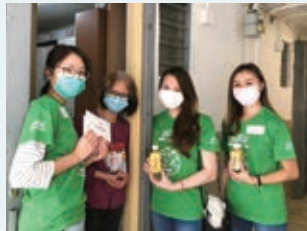
捐出口罩及 抗疫物資， 透過香港復 康會送予約 1,500個有需 要家庭