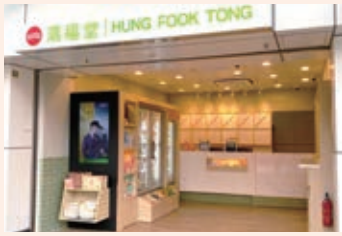
於港鐵 顯徑站 開設新店