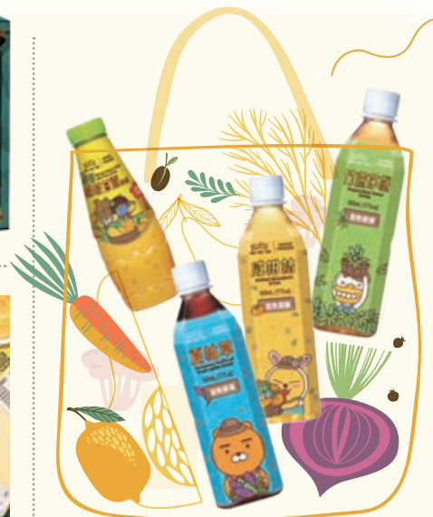
聯乘KAKAO FRIENDS 推出特別版飲品