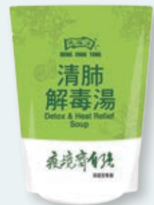
推出清肺系列新品 「清肺解毒湯」