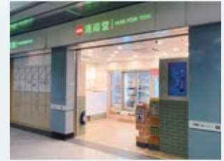
於港鐵南昌站開設新店