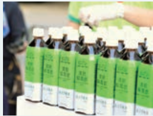
推出「清肺 解毒飲」並 贈送予社區 ，同心抗疫