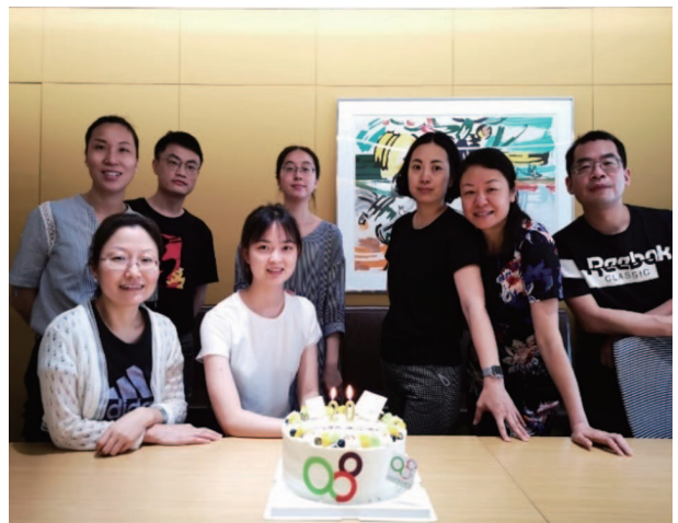
為僱員舉辦生日會