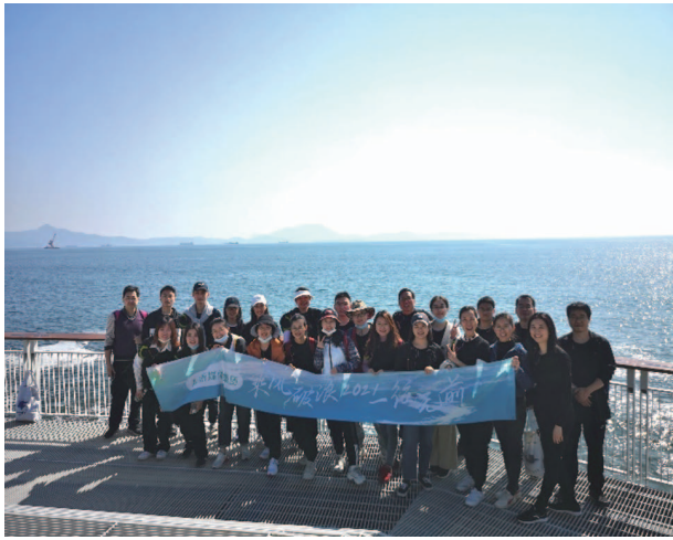
組織僱員參加集體健身活動