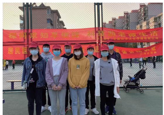
醫保電子憑證推廣活動