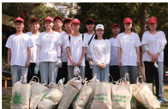
安徽新華學校2020年暑期「三下乡」社會實踐紀實