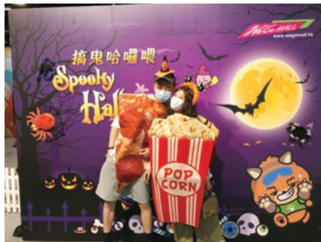
We Go MALL之搞鬼哈囉喂