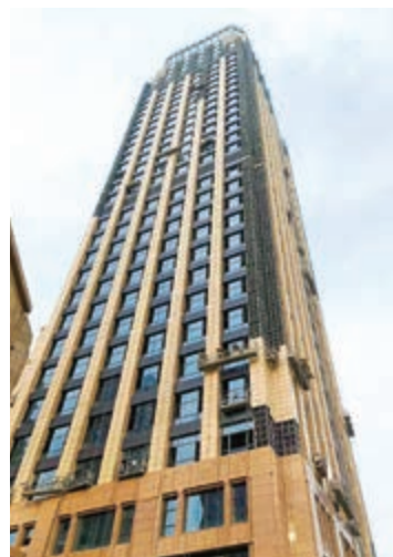
寫字樓大樓 — 上蓋建築工程現正進行中