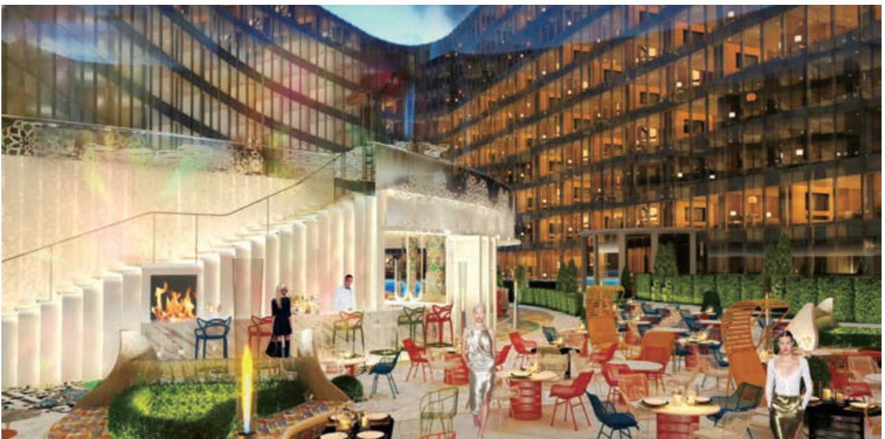
麗豪航天城酒店之西餐廳(*)