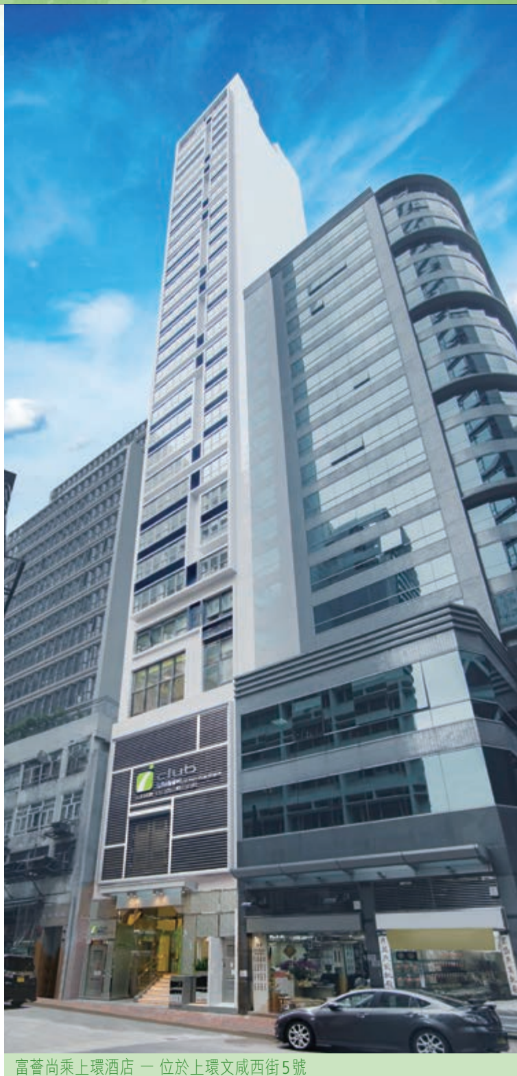
富薈尚乘上環酒店 — 位於上環文咸西街5號