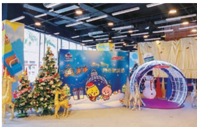
We Go MALL之聖誕節裝飾