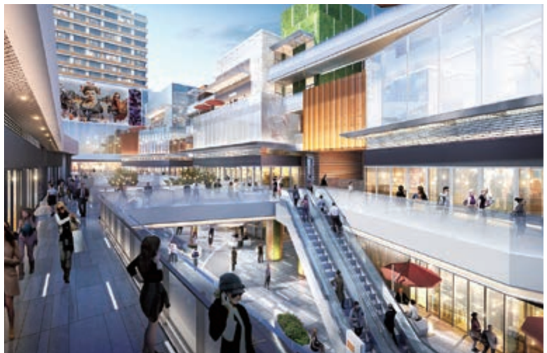
富豪國際新都薈之購物商場(*)