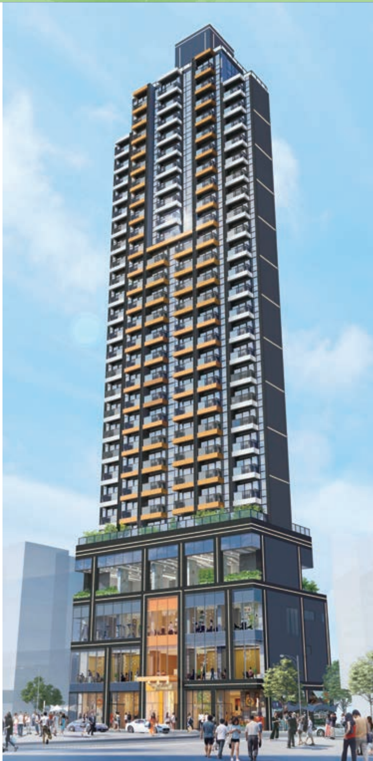
尚瓏(*) — 位於香港皇后大道西 150-162 號商業 / 住宅發展項目