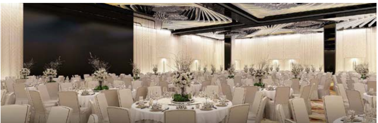
麗豪航天城酒店之宴會廳(*)