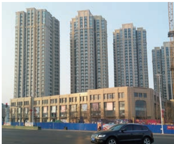
富豪新開門之住宅大樓及商業綜合大樓 — 已落成