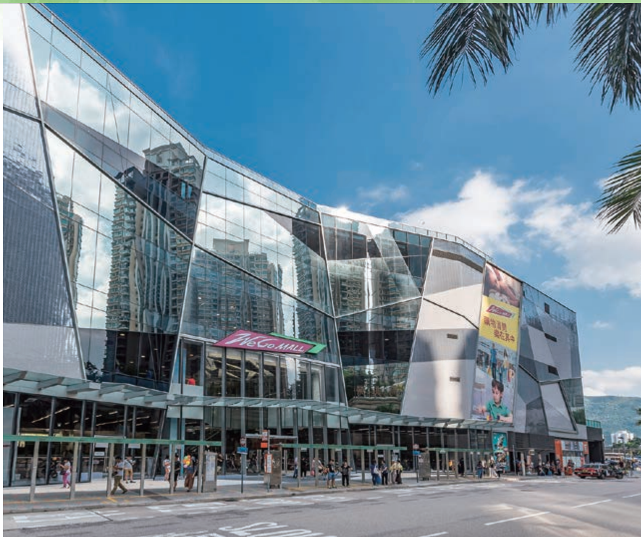
We Go MALL — 位於新界沙田馬鞍山保泰街16號之購物商場