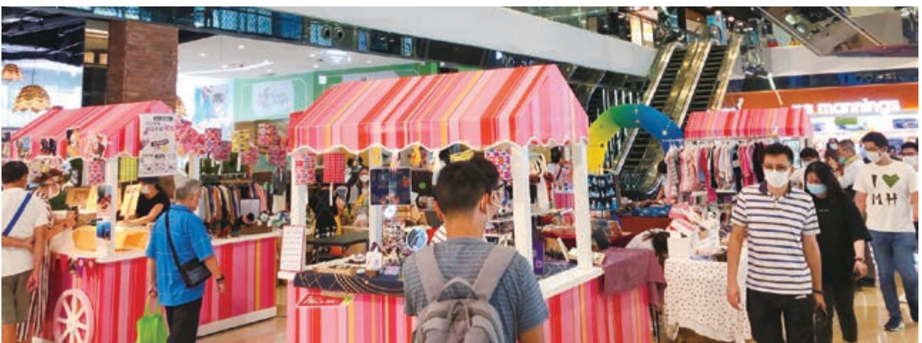
We Go MALL之寵物市集