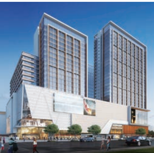
富豪國際新都薈之商業大樓/寫字樓(*)