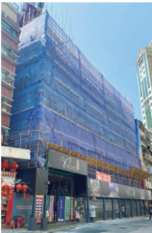
尚瓏 — 上蓋建築工程現正進行中