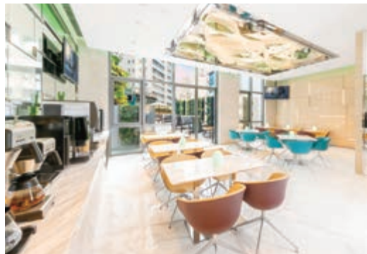
富薈尚乘上環酒店之 iLounge