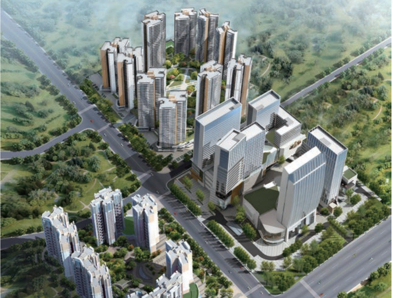
富豪國際新都薈－位於四川成都新都區之酒店/商業/寫字樓/住宅綜合發展項目(*)