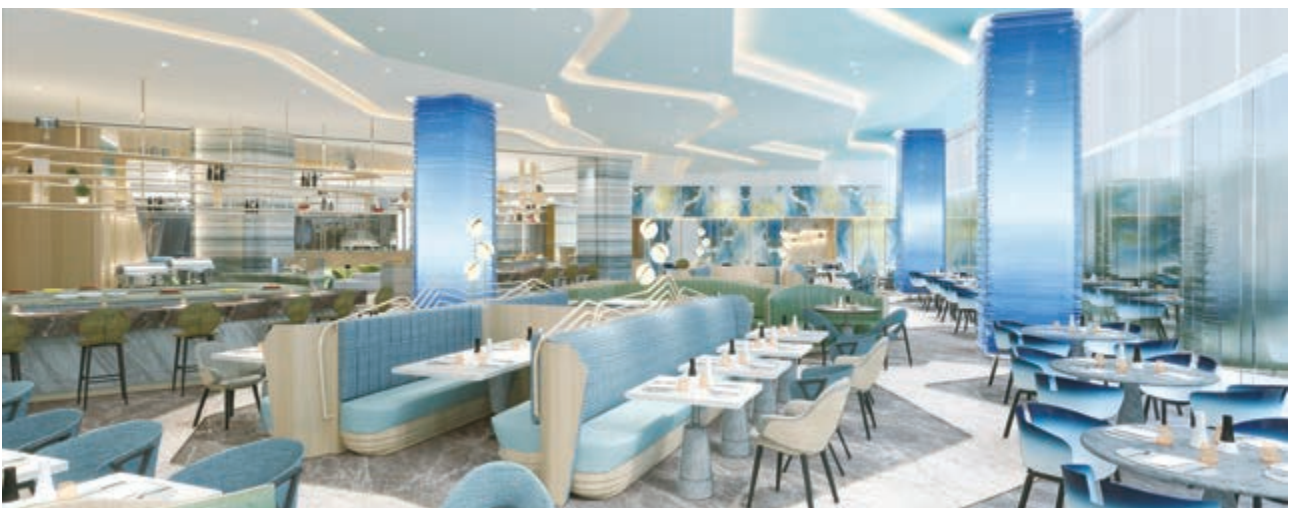
麗豪航天城酒店之咖啡廳(*)