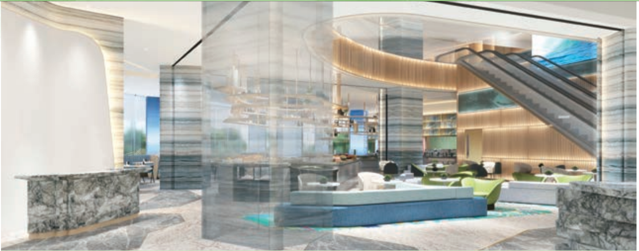
麗豪航天城酒店之主要入口(*)