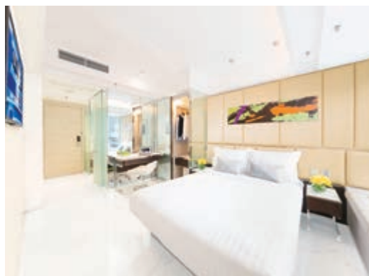
富薈尚乘上環酒店之富薈套房 Premier