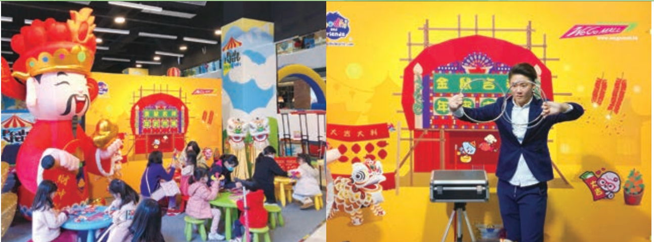
We Go MALL之農曆新年市集