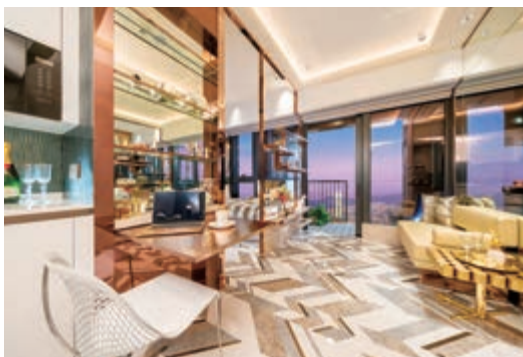
尚瓏之住宅單位之示範單位