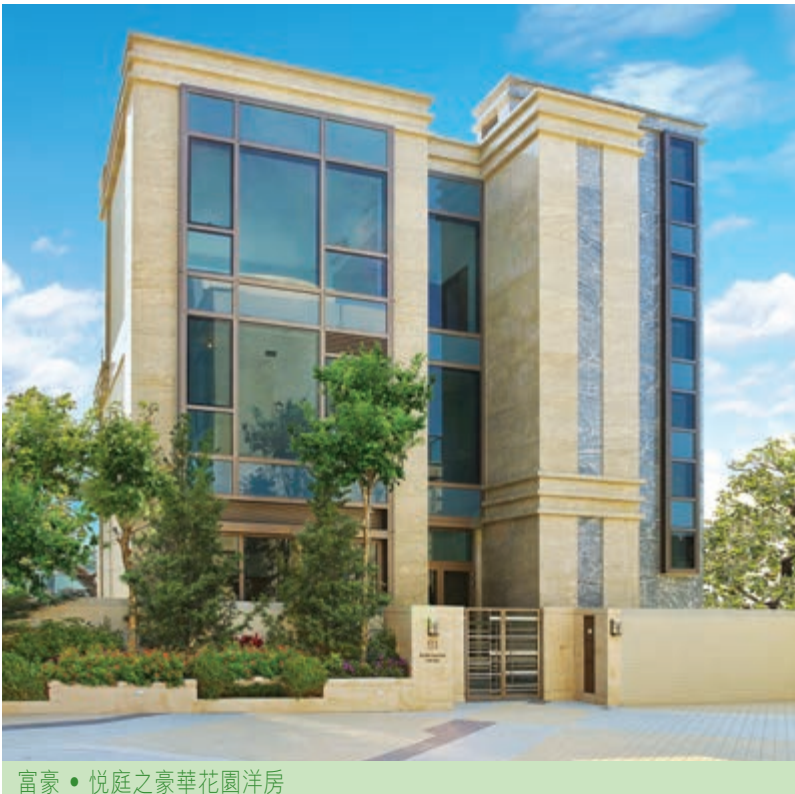
富豪 • 悅庭之豪華花園洋房