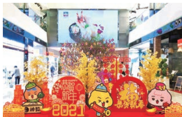
We Go MALL之農曆新年裝飾