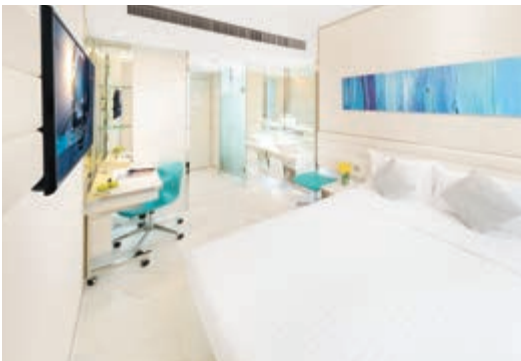
富蒼旺角酒店之尊薈