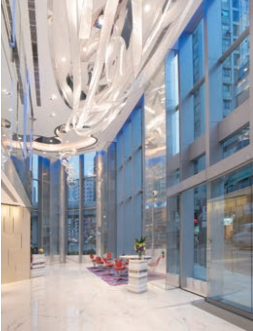
富蒼旺角酒店之大堂