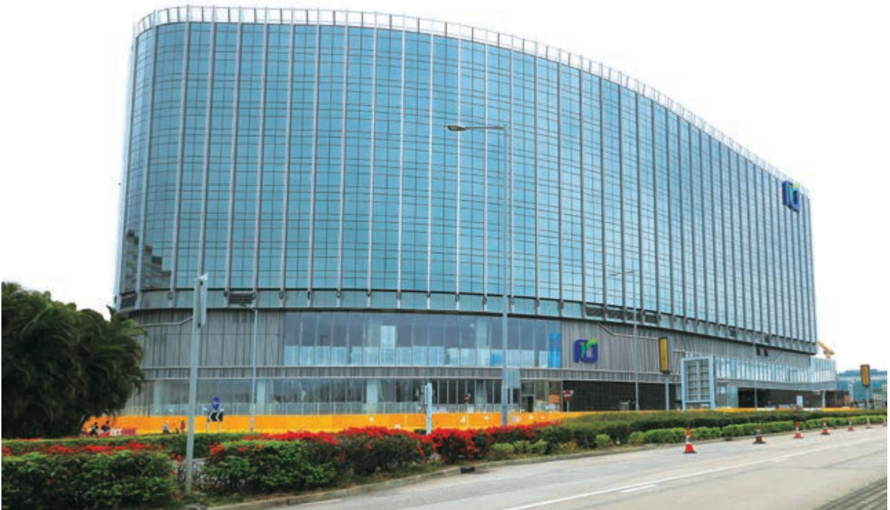
位於香港國際機場赤鱗角地段第3號將予命名為「麗豪航天城酒店」之新酒店項目