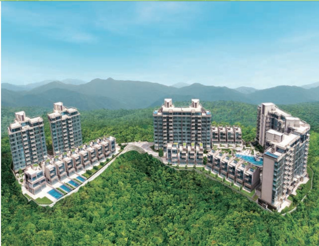
富豪 • 山峯 — 位於新界沙田九肚麗坪路 23 號之豪華住宅發展項目