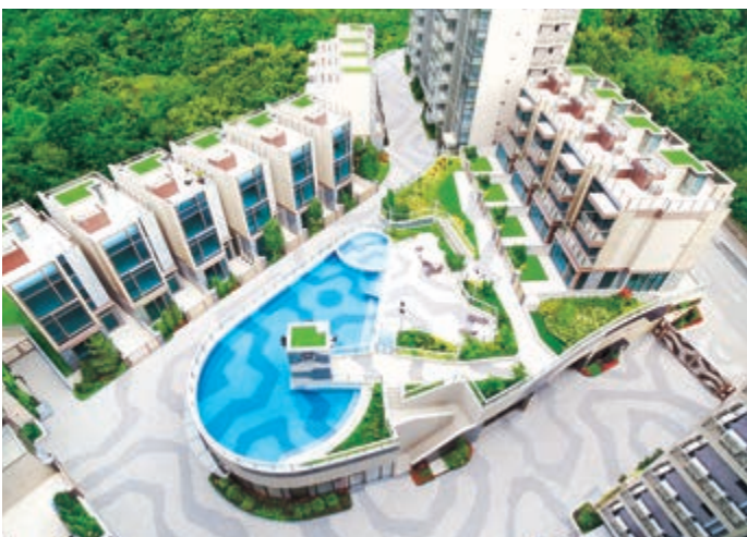
富豪 • 山峯之泳池