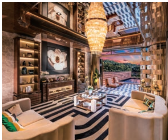
富豪 • 山峯之花園洋房之客廳