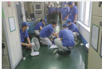
急召式生產安全事故預案演練