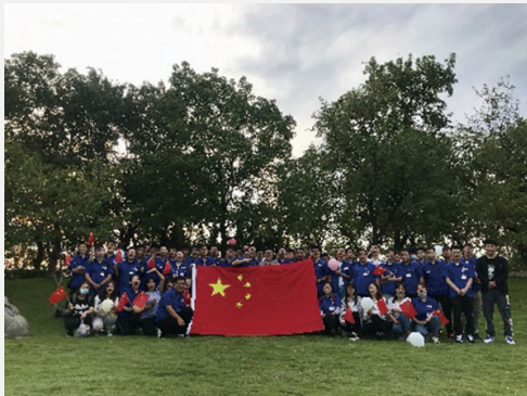
新入職員工戶外拓展