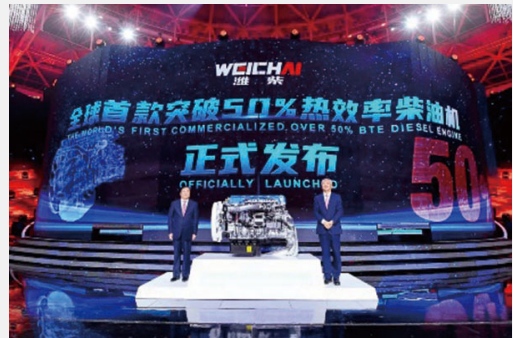
全球首款突破50%熱效率柴油機發布

公司重視天然氣發動機產品開發，目前在國內市場份額超過50%，未來將繼續推動天然氣發動機銷售。