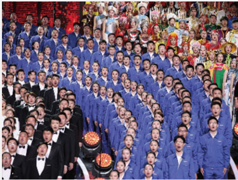
「黃河入海」交響音樂會