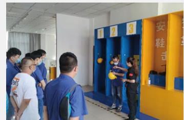
安全生產應急科普體驗