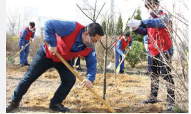
「植綠護綠」志願活動