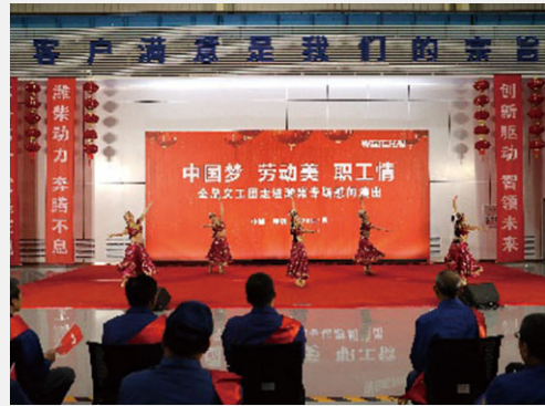
「中國夢·勞動美·職工情」慰問演出