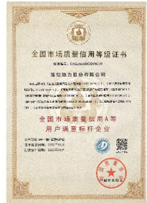
「全國市場質量信用A等用戶滿意標桿企業」證書

調動公司審核資源，組成專業審核小組，以質量體系成熟度模型為審核標準，針對性開展專項審核，不斷提高公司質量管理體系的有效性和效率，加強了業務與流程的融合度。