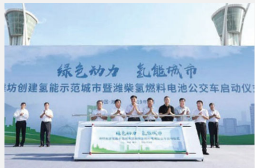
交付氫燃料電池公交車