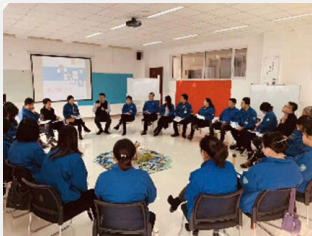
內訓師引導技術培訓