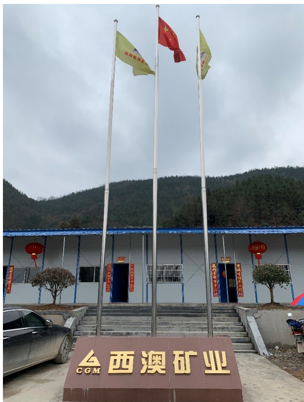
▲官莊金礦位於中國湖南省懷化市沅陵縣官莊鎮

本報告按照香港聯合交易所有限公司證券上市規則附錄 27 的環境、社會及管治報告指引編製，主要匯報本集團由 2020 年 1 月 1 日至 2020 年 12 月 31 日期間（「2020 年度」）的主要措施及活動。有關本集團的企業管治資料，請參閱本公司 2020 年度的年報。