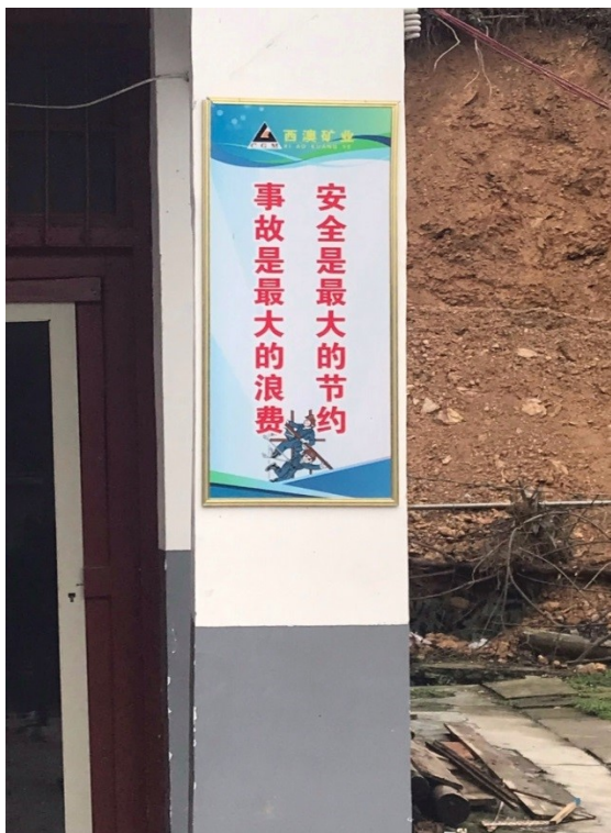
▲廠區內放置安全生產標語

本集團正在積極改善採礦產能及設施，以提高金礦產出效能。改善工程需要進一步資本投資包括以下幾個方面：(i) 位於東部地區礦山的礦場設施；(ii) 採礦產品加工廠房；及 (iii) 配套設施，包括礦井通風和空氣分配系統。