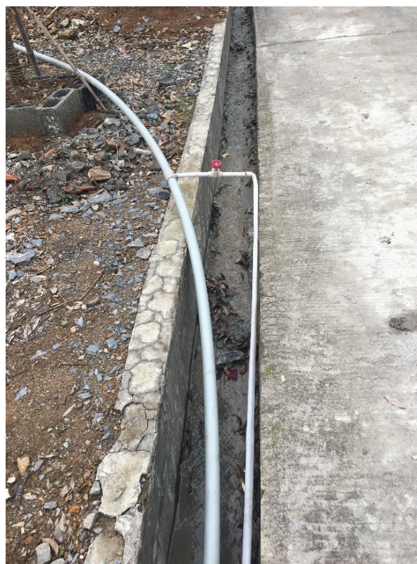
▲水管用作處理用水分流