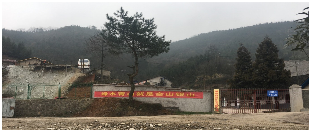
▲官莊金礦懸掛「綠水青山就是金山銀山」宣傳語

本公司的附屬公司湖南西澳礦業有限公司（「湖南西澳」）乃一間位於中國湖南省懷化市沅陵縣官莊鎮的中外合作公司，主要從事黃金開採、勘探以及買賣黃金產品。湖南西澳於官莊礦區的金礦範圍包括以下 8 個礦區的採礦權：小衝子礦區、抱木園礦區、沈家坳礦區、德勝礦區、鄭家山礦區、久發礦區、金竹灣礦區及湘魯礦區。湖南西澳其後對上述 8 個採礦權進行了整體收購並辦理了礦區範圍變更手續，經省級國土資源廳核准，整合為“湖南西澳礦業有限公司官莊金礦”（「金礦」）。由於湖南西澳是本集團中的唯一的一間對環境、社會及管治具有較高影響性的公司，所以本報告主要披露湖南西澳於 2020 年度在環境、社會及管治方面的政策及相關表現。