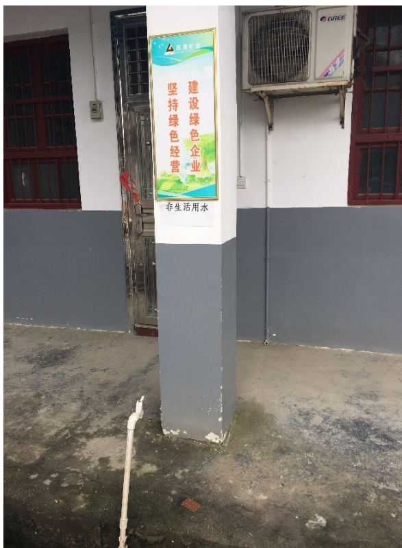
▲廠區內放置綠色標語致力建設綠色企業

為了貫徹落實中華人民共和國環境保護法，以減少或防止對自然環境的破壞和污染、保護和改善礦山環境，以及推進生態工作，湖南西澳根據已制定的保護制度修建環保型企業。保護制度是根據國家、行業及地方的有關法律、法規、標準及上級有關規定而制定。對於環境保護工作，員工需遵循“預防為主，防治結合”、“誰污染誰治理”的原則，實施“縱到底，橫到邊”的管理體系。