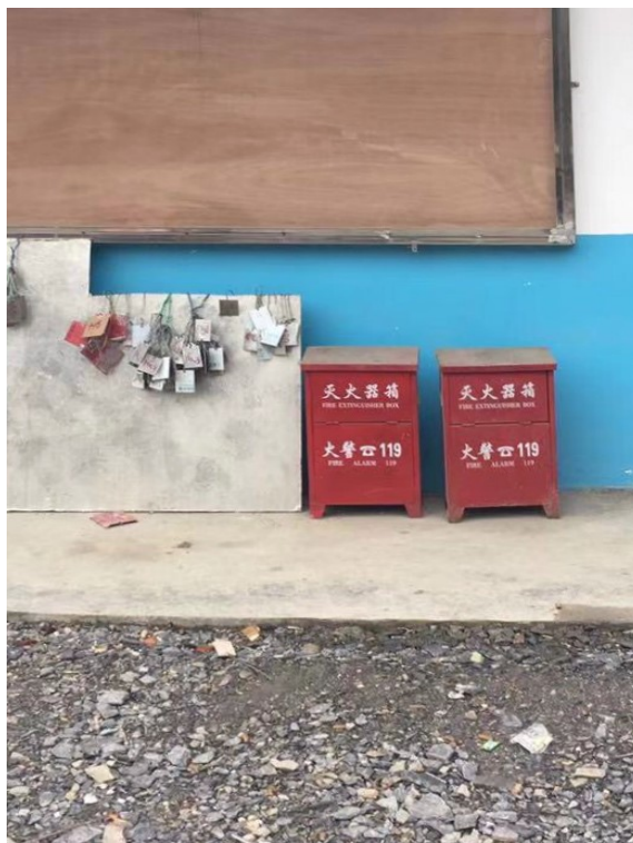
▲礦區內設置消防設備

於 2020 年 1 月 13 日，湖南西澳曾發生生產安全責任事故，該事故造成 1 人死亡及 1 人受傷。經當地政府成立的事務調查組調查後認定，湖南西澳在該次事故中違反了《中華人民共和國安全生產法》第二十七條第一款和第三十八條第一款、《金屬非金屬地下礦山企業領導帶班下井及監督檢查暫行規定》第四條第一款和第八條第一款及《生產經營單位安全培訓規定》第四條第五款、第九條第二款和第十三條第二款。根據事故調查組提出的事故防範措施之建議，湖南西澳已於 2020 年度實施整改建議，包括但不限於：(i) 加強嚴格執行《領導帶班下井制度》，帶班管理人員做到與工人同時下井、同時上井；(ii) 落實《交接班制度》，帶班管理人員如實填寫交接班紀錄；(iii) 落實《安全教育培訓制度》，對新進員工安全教育培訓不少於 72 個學時，主要負責人及安全管理人員每年再培訓不少於 12 個學時，從業人員每年再培訓不少於 20 個學時；(iv) 加強嚴格執行《下井人員掛牌制度》和《下井安全管理制度》；及 (v) 落實《安全隱患排查治理制度》，展開安全隱患排查治理，對新發現的安全隱患採取技術措施進行治理。