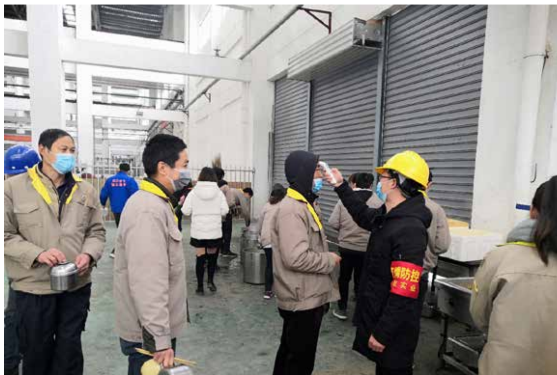
進入生產設施前的提問檢測

鑒於COVID-19大流行，本集團把預防和消除工作場所周邊的疾病列為最高優先事項。本集團隨即制定預防措施行動，包括提高員工防疫意識、保持良好溝通，以及加強個人衛生。本集團亦列明與個人衛生防護相關的措施，如將用餐時間分成三段，避免擁擠、要求員工佩戴口罩並常洗手，並通過社會媒體教育宣傳疾病預防相關知識等。除此之外，本集團位於南洋的生產設施已要求僱員取得工人健康證明書，方可進入工作場所範圍。為確保員工遵守有關COVID-19的安全防範措施，本集團成立了疾病防控工作小組，負責監督COVID-19防控行動計劃的執行及效果。