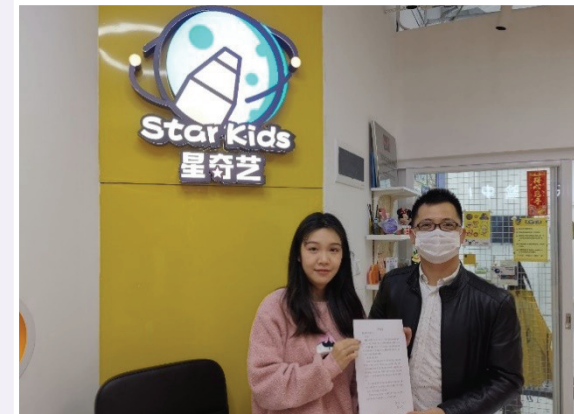
租戶向我們的租金減免措施表達感謝

此外，面對該疫情爆發，為了履行社會責任和發揮國有企業的帶頭作用，我們採取了積極的措施保障旗下商業項目如常運作，如採取租金減免等相關措施。我們全年為中小租戶減免租金累計達人民幣115.98萬元，惠及直接租戶16個和間接租戶6個，幫助租戶渡過難關。