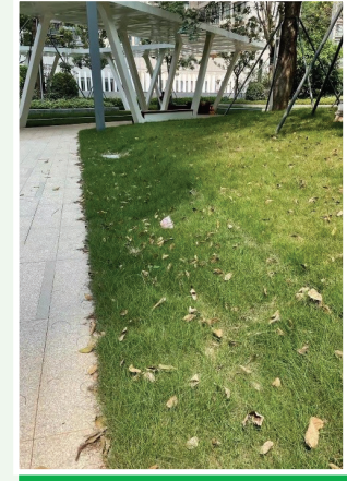
深圳粵海城項目的下凹式綠地設計