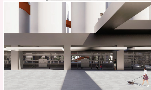
深圳金威啤酒廠的活化改造