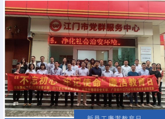
新員工廉潔教育日

粵海置地嚴格遵守《中華人民共和國反貪污受賄法》等相關法律，於本報告期內，本集團並無任何與貪污有關的法律訴訟，並為本集團董事及員工提供了共 16 小時的反貪腐培訓。