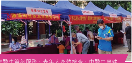
義診、家庭醫生簽約服務、老年人身體檢查、中醫中藥健康服務等活動

於2020年6月，粵海置地展開義診、家庭醫生簽約服務、老年人身體檢查、中醫中藥健康服務等活動促進社區衛生健康的發展。