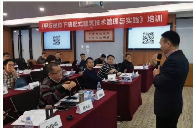
装配式建築技術管理與實踐專題培訓

此外，我們於年內舉辦了装配式建築技術的專題培訓，邀請外部專家為各部門的管理層及員工親臨授課。該課程涵蓋装配式技術的相關政策、趨勢及管理模式，促進該技術在本集團的新項目中的應用，為實現綠色建築出一分力。