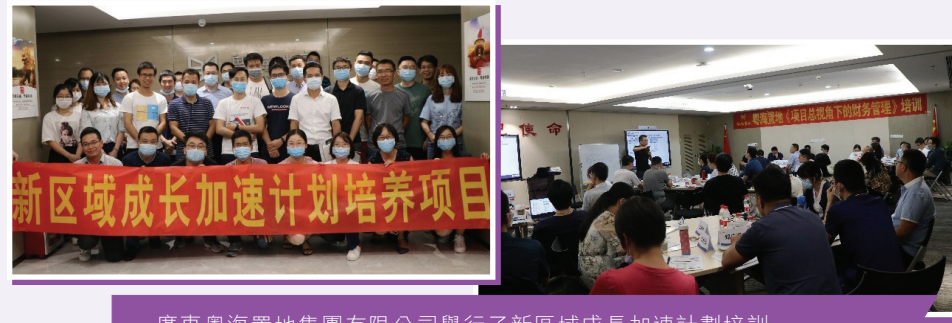
廣東粵海置地集團有限公司舉行了新區域成長加速計劃培訓

此外，為了鼓勵員工達至更全面的個人發展，我們會向參加外部進修課程的員工提供補助，讓員工自我進修。