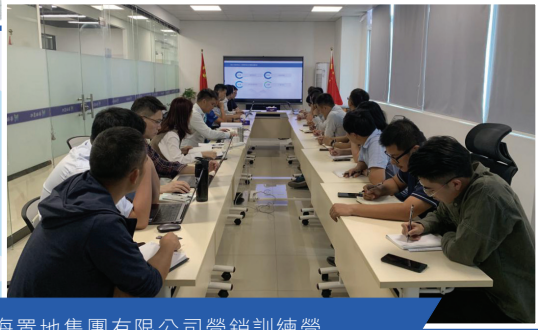
廣東粵海置地集團有限公司營銷訓練營