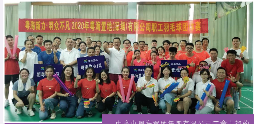
由廣東粵海置地集團有限公司工會主辦的職工羽毛球團體賽