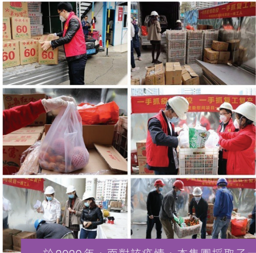
於2020年，面對該疫情，本集團採取了一系列的疫情防控措施。

為防止該疫情散播，我們向員工分發口罩等防疫衛生用品、時刻加強辦公室、項目內部及周邊環境的消毒清潔工作，並每天檢測員工體溫。而為了響應社交隔離的要求，我們亦為員工提供在家工作及彈性上班的選項，保障員工的健康安全，讓員工安心。