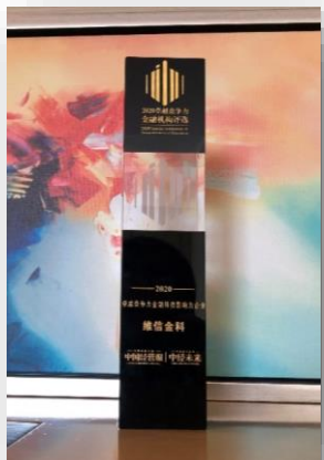
2020 卓越競爭力金融科技影響力企業 頒獎單位：中國經營報