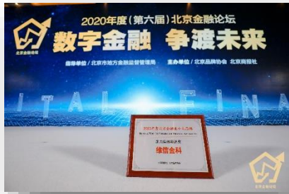
助力實體經濟獎 頒獎單位：北京商報