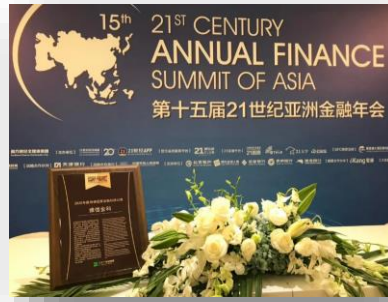
21世紀亞洲金融競爭力評選--年度穩健經營獎 頒獎單位：二十一世紀經濟報導