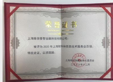
2020 年上海軟體和資訊技術服務業百強 頒獎單位：上海市經濟和資訊化委員會