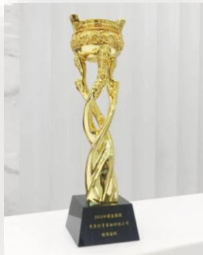
第十一屆中國金鼎獎--年度優秀金融科技公司 頒獎單位：每日經濟新聞