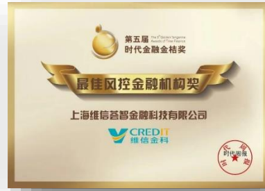
最佳風控金融機構獎 頒獎單位：廣東時代傳媒