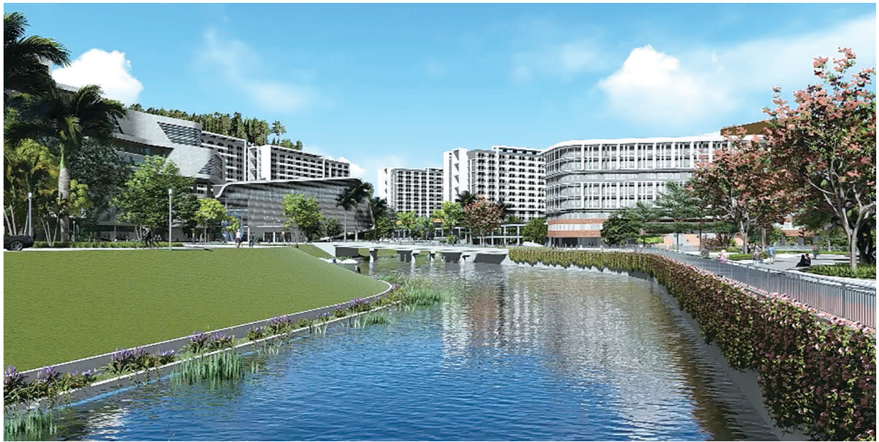
廣州應用科技學院新校區