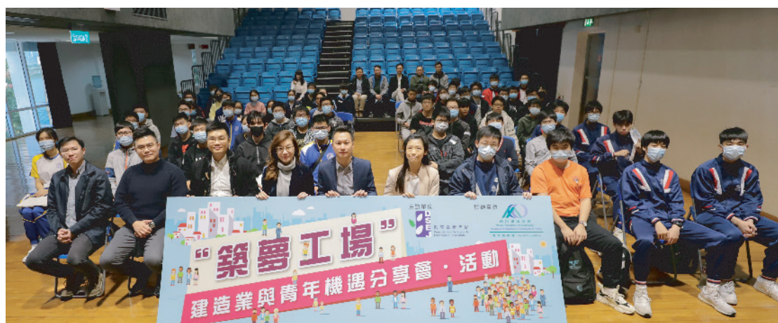
「築夢工場」- 建造業與青年機遇活動