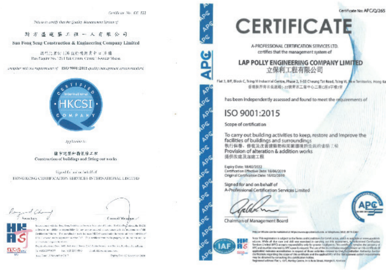
澳門及香港子公司的ISO 9001:2015 認證

本集團的質量管理體系已通過國際標準ISO 9001:2015的認證，為我們於建立質量政策和目標、建築活動的糾正和預防措施的過程提供框架。此質量管理體系由四個關鍵流程組組成，並為監控和控制集團的產品和服務質量奠定了更具系統化的基礎。我們就該四個關鍵流程組設計策略和計劃，同時採用與小組目標相關的關鍵績效指標來控制和監視相關表現。