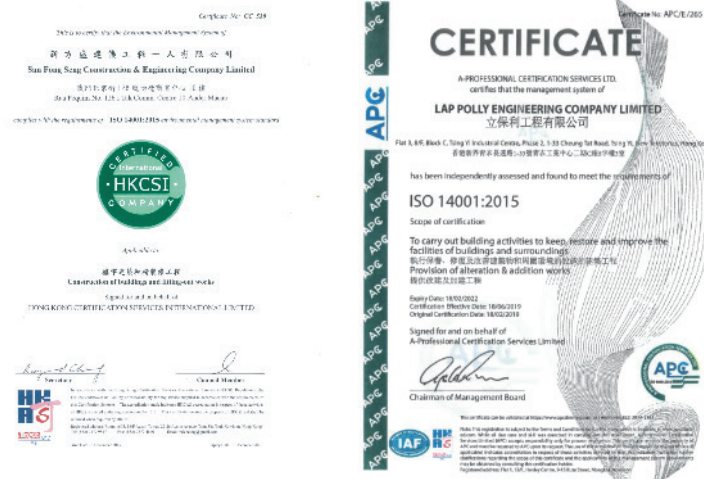
澳門及香港子公司的ISO 14001:2015 認證

為了策略性地減少本集團的總體溫室氣體排放、提高我們於資源和能源消耗以及廢物產生方面的環境績效，我們編製了獲得ISO 14001:2015認可的環境管理系統，以識別、管理和減輕於建築和營運期間所產生的環境污染，並提供一個框架來制定特定及可衡量的環境目標，以提高我們的環境績效。同時，我們亦會定期審視已制定的環境政策和目標，以確保能夠符合法定要求和標準。