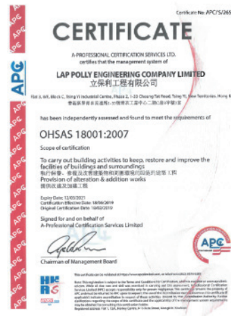
澳門及香港子公司的OHSAS 18001:2007 認證