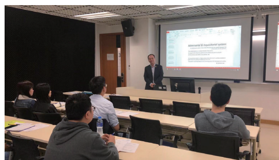
員工報讀建設商務管理(工料測量)高級專業文憑