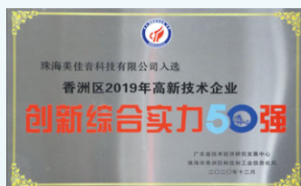
2020年11月，珠海美佳音榮獲「香洲區2019年度高新技術企業創新綜合實力50強」稱號。