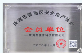
2020年11月，珠海美佳音被珠海市香洲區安全生產協會評為「珠海市香洲區安全生產協會會員單位」。