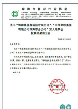
2020年4月，珠海美佳音被珠海市耗材行業協會評為「珠海市耗材協會副會長單位」。