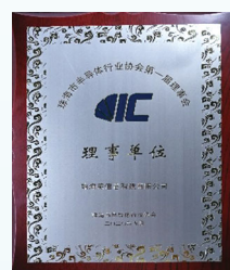
2020年9月，珠海美佳音被珠海市半導體行業協會評為「珠海市半導體行業協會理事單位」。