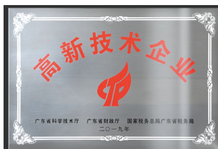
2019年，珠海美佳音獲確認為「高新科技企業」，為期三年。