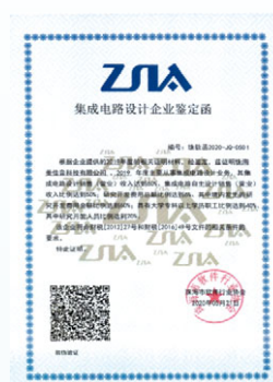
2020年5月，珠海美佳音收到珠海市軟件行業協會頒發的「集成電路設計企業鑒定函」。