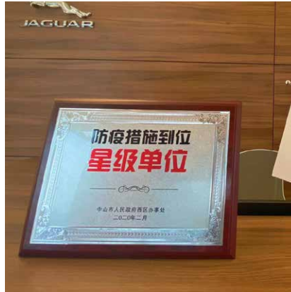
榮獲中山市西區辦事處頒發《防疫措施到位星級單位》