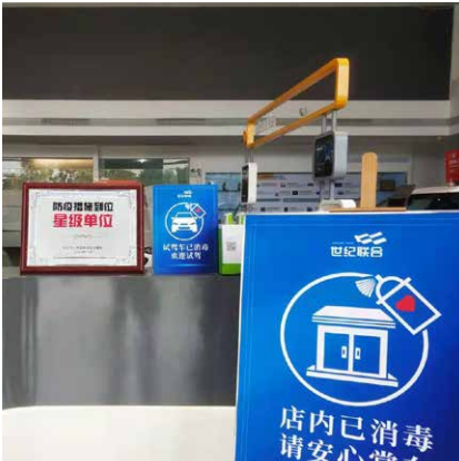
所有環境堅持每天消毒