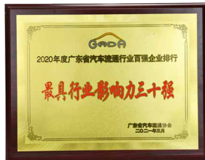
廣東省汽車流通協會 - 2020年度廣東省汽車流通行業百強企業排行中的「最具行業影響力三十強」