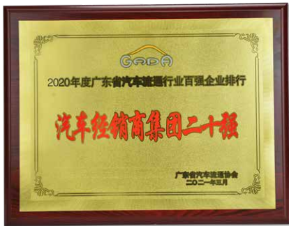
廣東省汽車流通協會 - 2020年度廣東省汽車流通行業百強企業排行中的「汽車經銷集團二十強」