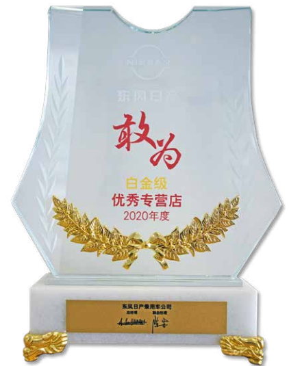
中山市東日汽車銷售服務有限公司斬獲東風日產乘用車公司「白金級優秀專營店」