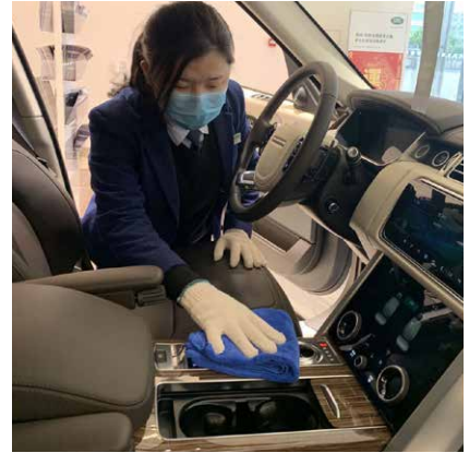
員工每天堅持展車消毒

本集團極其重視新冠肺炎對其僱員以及客戶帶來的潛在健康及安全影響。因此，在疫情出現之初，本集團已對疫情形勢緊密監控，並制定了一系列措施及指南，如《各類防護指南》、《創世紀疫情防控工作方案》以及《保安保潔優化方案》等，明確指引及規定僱員必須遵守的防疫工序，並於《各店防疫負責人》裡清晰任命了各經銷門店的防疫負責人，以進一步加強僱員的防疫意識以及管理。與此同時，本集團為各經銷門店提供足夠的抗疫及消毒物資，規定僱員及顧客在進入經銷門店前必須進行體溫檢測，並設立了廢棄口罩收集桶等設施以確保防止新冠肺炎的擴散及爆發風險。在嚴格的防疫措施下，目前本集團經銷門店全體人員實現零感染。