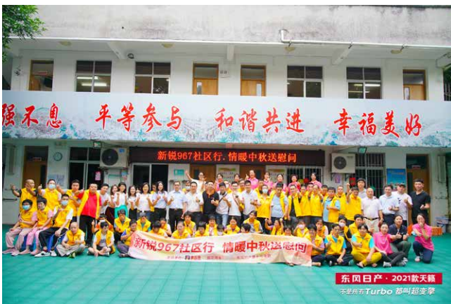
中秋為特殊學校送溫暖活動

本集團致力於在業務發展的同時為社會做出貢獻，並鼓勵僱員積極參與公益活動。本集團認為僱員透過積極參與公益活動，能培養社會責任感以及為僱員樹立正確正面的價值觀。於報告期間，本集團已透過提供活動用車及贈送小禮物等途徑積極贊助多個大型活動，包括東區花苑社區「創文在路上黨員當先鋒」為主題的「情暖中秋送慰問」志願服務活動以及「電台母親節歡樂送」活動等。同時，本集團堅持以熱誠為本，致力履行社會責任，積極參與社區投資。本集團深信企業的可持續發展倚賴社區的穩定和安康，因此將繼續鼓勵僱員積極參與社區活動、為社區做貢獻。