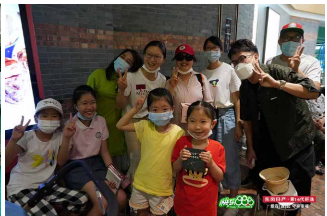
電台母親節歡樂送活動