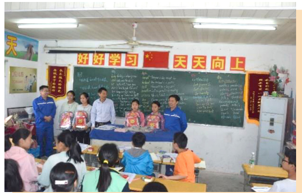
捐贈卜陳小學學生書包