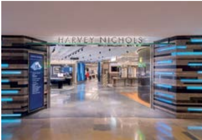
Harvey Nichols store at Pacific Place, Hong Kong. 位於香港太古廣場的「Harvey Nichols」店。