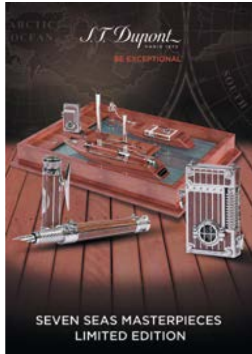
S.T. Dupont 'SEVEN SEAS MASTERPIECES LIMITED EDITION' lighters and writing instruments. 「都彭」的「SEVEN SEAS MASTERPIECES 限量版系列」打火機及書寫文具。

在中國，本集團成功地重組其架構，加上其零售業務表現強勁，使本集團在中國之全年業務轉虧為盈。展望未來，鑑於中國的龐大發展機會，本集團將專注於擴展其實體店鋪網絡及線上業務之發展。