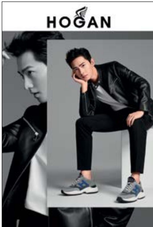
Shoes by Hogan. 「Hogan」鞋履。