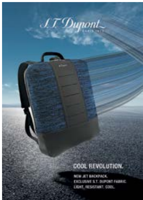
S.T. Dupont 'JET MILLENNIUM' backpack. 「都彭」的「JET MILLENNIUM」背包。