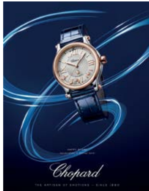
Chopard 'HAPPY SPORT' watch. 「蕭邦」的「HAPPY SPORT」腕錶。