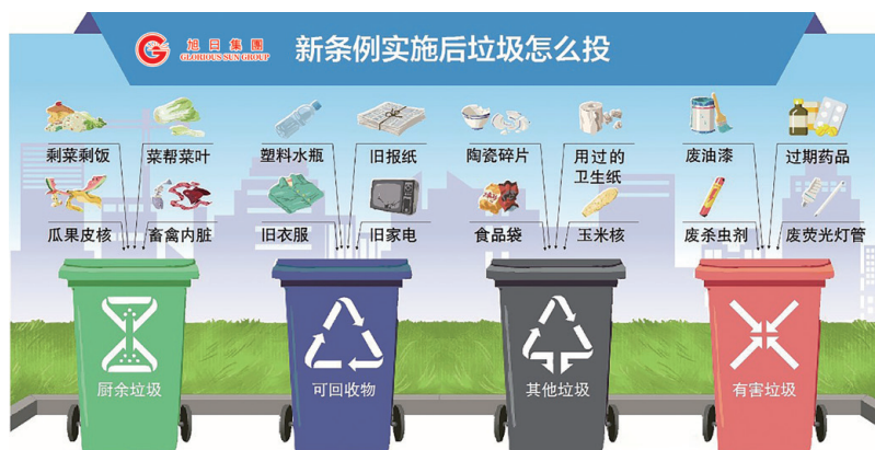
● 本集團中國總部設置四類垃圾回收桶

2020年，本集團在中國總部進一步推行垃圾分類工作，在園區設置四大類垃圾回收桶：「廚餘垃圾」、「可回收物」、「其他垃圾」及「有害垃圾」，實現垃圾資源利用，減少環境污染。