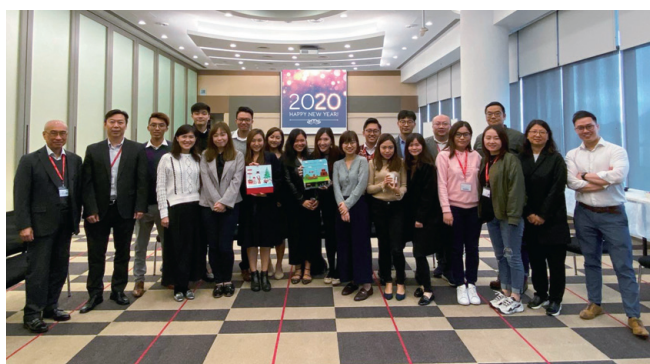
● 2020年初，管理層與見習行政主任進行節日聚會迎接新年來臨