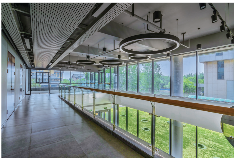
● 常宏BIM+裝配式技術應用於河北省建築科技研發中心實驗樓項目