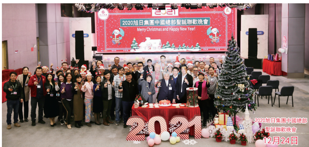
● 管理層與員工在中國總部一起慶祝聖誕節

員工福利：依法購買勞工保險或社會保險、住房公積金（中國內地適用）；除社會保險外，本集團亦為所需要的員工購買人身意外保險，保障員工的人身安全。本集團各地區辦公室均嚴格執行香港、中國內地的相關法律法規，員工可享有薪假期福利，包括法定假期、年假、病假、婚假、產假 / 生育假期、侍產假（適用於香港）、看護假（適用於中國內地）、喪假及工傷假等。