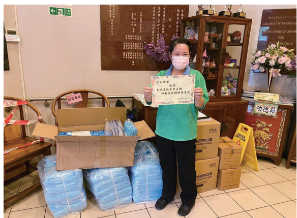
● 本集團香港公益組向老人院舍捐贈抗疫物資