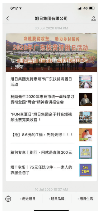
● 旭日微信公眾平台

微信資訊平台及Facebook專頁： 隨著即時通訊工具—微信和Facebook的流行，本集團開通了微信公眾號，而旗下服裝品牌Jeanswest也開通了Facebook專頁，讓員工和顧客即時瞭解本集團的最新企業資訊、Jeanswest品牌推廣、企業文化及公益活動動態。