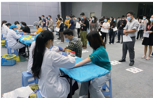
● 中國總部進行年度員工健康體檢