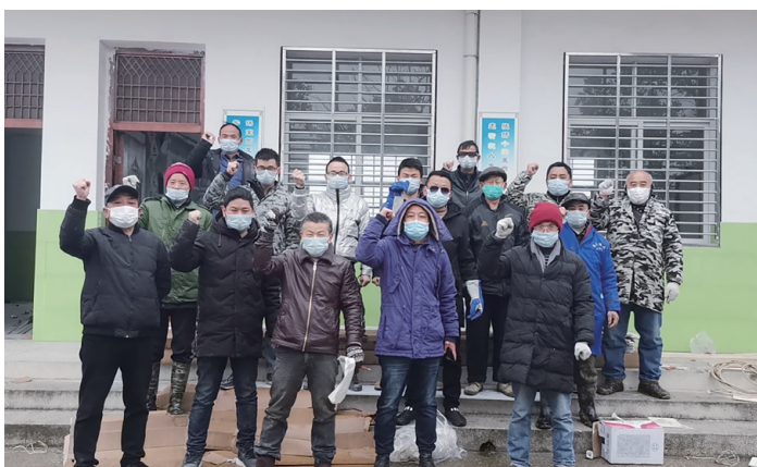
● 常宏馳援湖北漢川助力鄉村戰「疫」抗疫

不論是在貧窮地區興建中小學、資助大學生、或推動服裝行業人才培訓，本集團著眼於社會的長期利益，幫助受助者自助，讓他們得到好的學習或發展條件，日後貢獻社會。