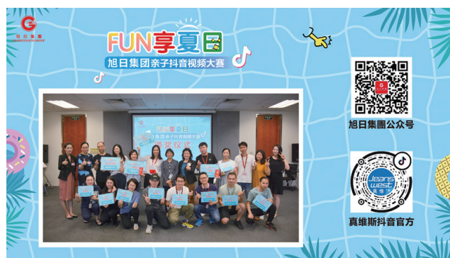
● 2020年舉行「FUN享夏日」親子抖音短視頻比賽活動，促進員工的家庭關係