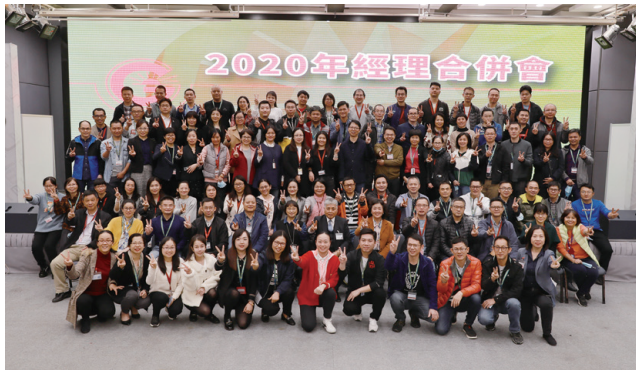
● 經理會年度回顧分析國家政策及市場趨勢

集團中國總部經理會： 經理會旨在培養公司管理骨幹精英人才，設有工作委員會執行日常管理，並下設活動統籌組、交流研討組、公關推廣組及秘書財務組。經理會每年不定期組織對內對外的拓展、研討及講座等活動，促進成員的交流，擴展視野，提升成員的凝聚力和綜合素質。