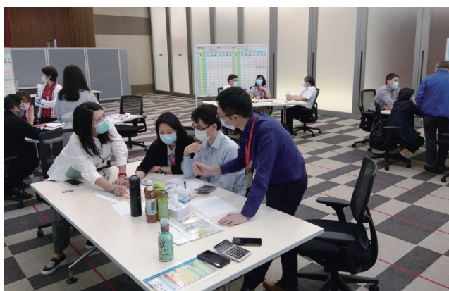
● 本集團進行不同職級的核心培訓

在2020年，本集團除了舉行了不同職級的核心培訓外，亦舉辦了「全國兩會精神宣講分享會」，讓員工了解國家最新發展方向；邀請了律師為員工分別講解《中華人民共和國民法典》和「經濟合同法、軟件著作權」；在香港，舉辦了「正能量•表達技巧提升工作坊」，提升員工溝通和演說時的正能量。由於新冠肺炎疫情關係，本集團的培訓部減少線下聚集培訓，開展線上教學以保持社交距離。在香港，以Zoom視像會議形式舉辦「中文商業寫作技巧」課程及舉辦「白板書寫工作坊」；在中國總部，推出多項網上課程，包括為出口業務和零售業務員工提供「網絡營銷」、「電子商務」及「國際市場營銷」等課程。