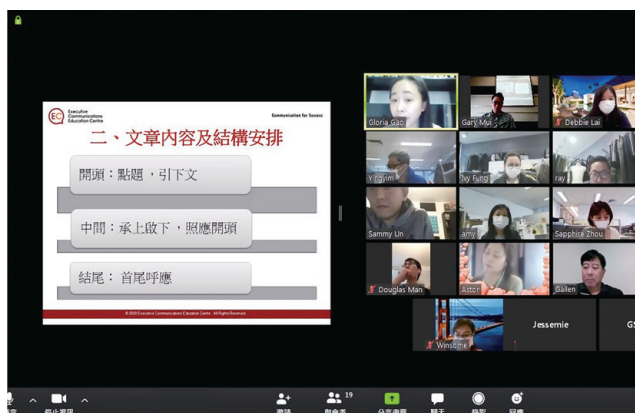
● 因應新冠肺炎，本集團進行多項網上培訓