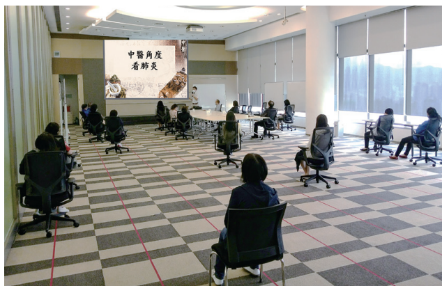
● 本集團為員工舉辦中醫講座，助員工由內到外預防肺炎