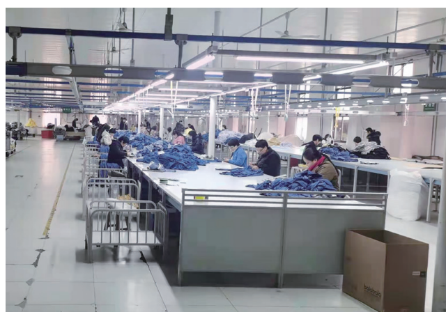
● 本集團推行社會責任評核工廠制度

由於新冠肺炎疫情影響，導致業務量下降，工廠營運困難，因此評核的工廠數量減少。每年本集團安排最少兩次與供應商進行會議，總結工作及討論業務發展的形勢，具體交流則會在工廠評審過程中實施。