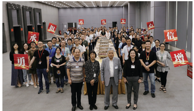
● 經理會聚餐活動，結合學習和生活

《旭日之聲》： 每月印刷的企業刊物，派發予同事及本集團友好，員工可以通過此刊物充分瞭解本集團的發展方向及工作目標，是本集團傳播文化及凝聚員工力量的工具。