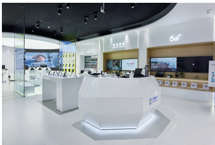
● 常宏為位於深圳的中國移動「5G Outlet」新廳提供設計服務

所有室內設計及裝修工程項目，經過自檢合格後，須由工程所屬區域或事業部工程管理部门、總部質檢部進行驗收。參與驗收工作的人員須依據相關標準規範及設計文件進行驗收工作，並整理驗收報告。項目部在驗收工作完成7天內，按驗收人員在驗收過程中提出的問題進行整改，合格後由工程對應負責的總部質檢員作出驗收報告，並由項目經理及參與驗收的人員批簽確認。對工期超過兩個月的工程，可進行分部、分項驗收。當工程項目存在問題時，需進行二次驗收。工程項目於二次驗收時，項目部整改完畢後按首次內部驗收程序重新申請內部驗收，參與驗收人員到現場進行二次驗收並由對應負責質檢員出具二次內部驗收報告。