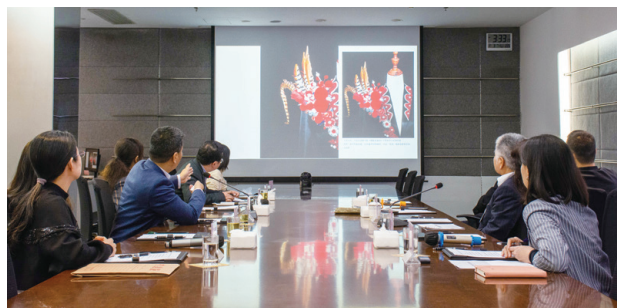
● 旭日廣東服裝學院領導到訪本集團作「競爭力提升計劃項目」年度工作總結會