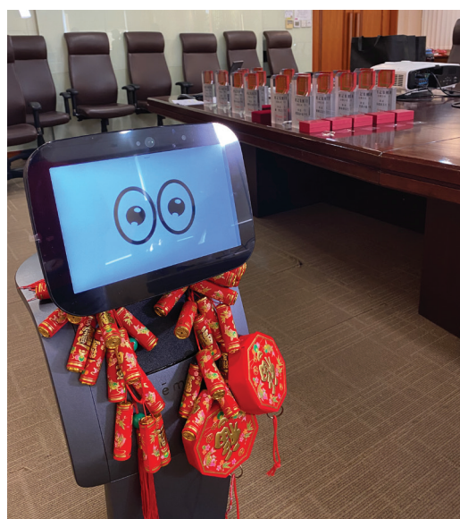
機械人大使在春節期間恭賀全體員工