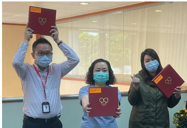
向好好社企購買餅乾以作支持