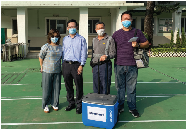
免費為中小學提供水質檢測服務

由於COVID-19疫情期間的社交距離措施及規定，我們的義工同事未能親身參加慈善活動。儘管如此，我們向香港海鷗助學團作出捐款，以支持貧困生。憑藉我們的專業知識，為大埔區及沙田區的中小學提供免費水質檢測服務。此外，我們亦向好好社企購買餅乾以作支持，提倡負責任的採購。透過不同的慈善計劃，我們正努力建設一個更具互助性及包容性的社會。