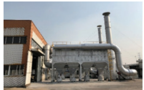
我們在寧波的廠房

附註：溫室氣體密度指相對於利記生產密度的溫室氣體排放率，我們採用產量來進行密度計算，以根據我們業務性質反映最合適的表示方式。