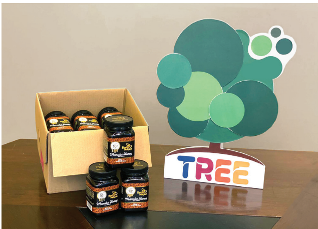
捐贈蜂蜜予一所中學增強學生健康