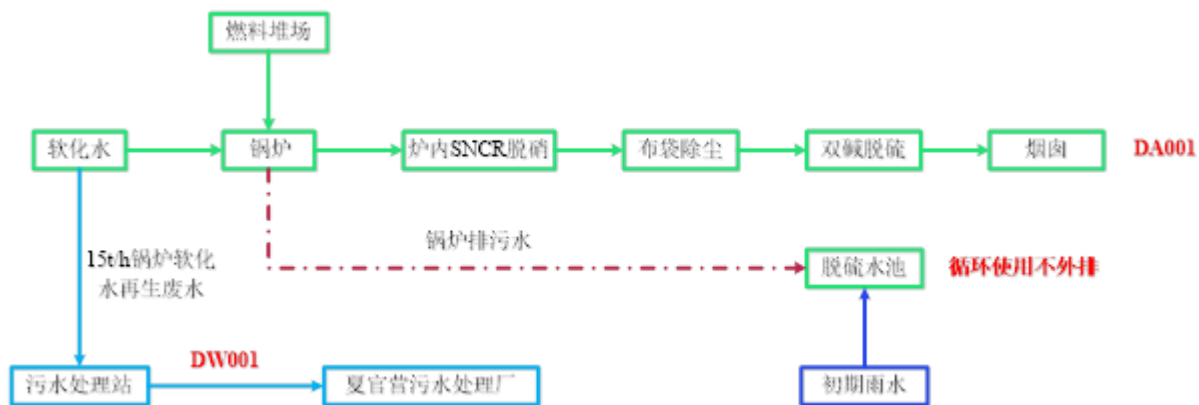
图1-2 锅炉生产工艺流程及产污节点图