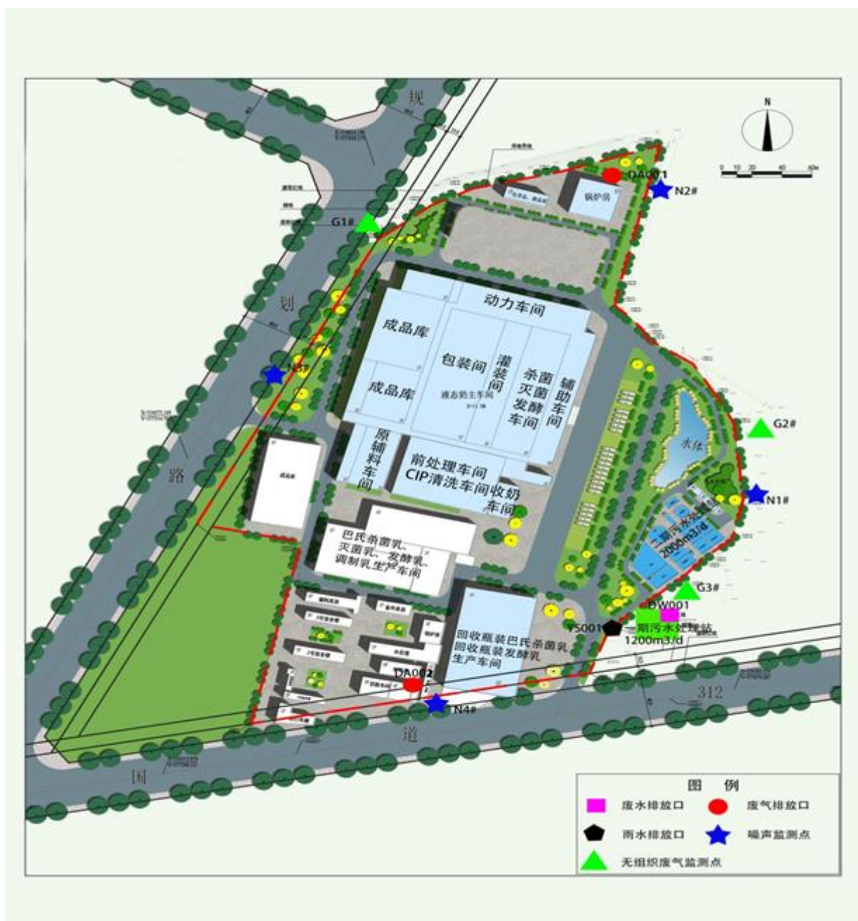
图1-3 监测点位示意图