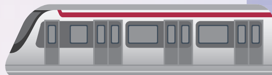
* Tseung Kwan O Line 將軍澳綫