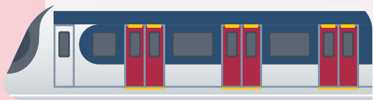
* East Rail Line 東鐵綫