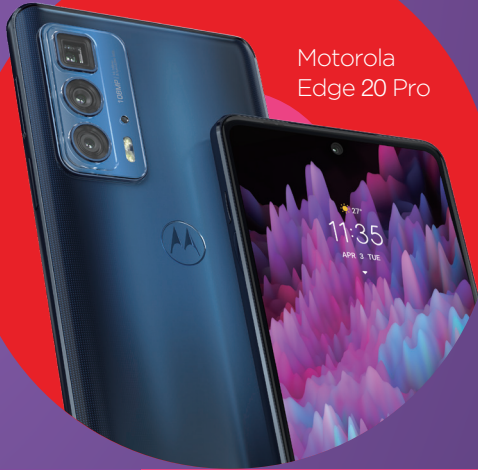
Motorola Edge 20 Pro