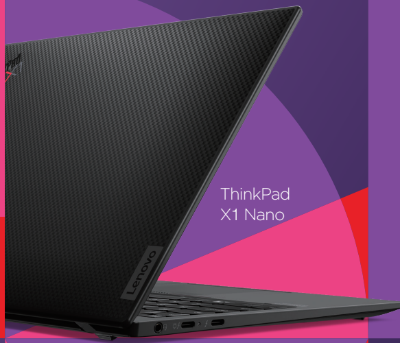
ThinkPad X1 Nano