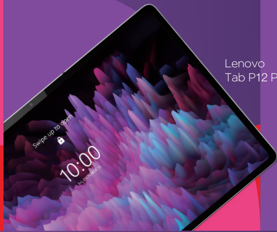
Lenovo Tab P12 Pro