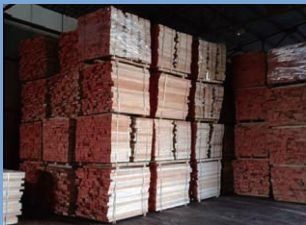
■ 本集團在羅馬尼亞之木材加工項目生產之板材

優化業務模式主要指歐洲之木材供應鏈營運的業務活動（「歐洲營運」）。優化業務模式本質上屬於垂直綜合之木材供應鏈營運，其涵蓋典型木材供應鏈之各項增值工作及服務，包括種植及採伐權、採購、木材採伐及伐木、品質檢查及陸運／海運、木材加工、庫存管理、清關、銷售及營銷以及售後服務。木材供應鏈營運現時通過其在斯洛文尼亞、羅馬尼亞及克羅地亞之三個分銷中心以及在羅馬尼亞及克羅地亞之兩個木材加工項目運行優化業務模式。於二零二一年上半年，木材供應鏈營運之優化業務模式產生收入港幣108,738,000元（二零二零年九月三十日：港幣92,206,000元）及溢利港幣4,073,000元（二零二零年九月三十日：港幣4,377,000元），相當於原木及木製產品交易量超過54,000立方米（二零二零年九月三十日：77,000立方米）。優化業務模式錄得收入增長惟交易量減少，乃由於期內貿易組合變動，當中銷售更多具有較高銷售價值及利潤之加工木製品，儘管所賺取之較高利潤部份被運輸及貨運成本普遍上漲所抵銷。有關成本上升主要由於新型冠狀病毒(COVID-19)疫情長期持續，導致中歐航線之正常物流延遲及中斷，令集裝箱短缺所致。