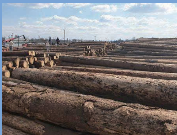
■ 本集團在斯洛文尼亞之分銷中心